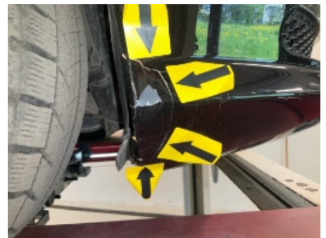
18. Støtfanger foran