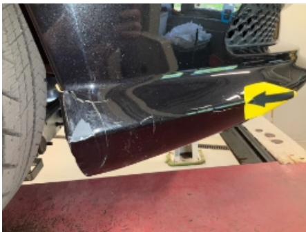
19. Støtfanger foran