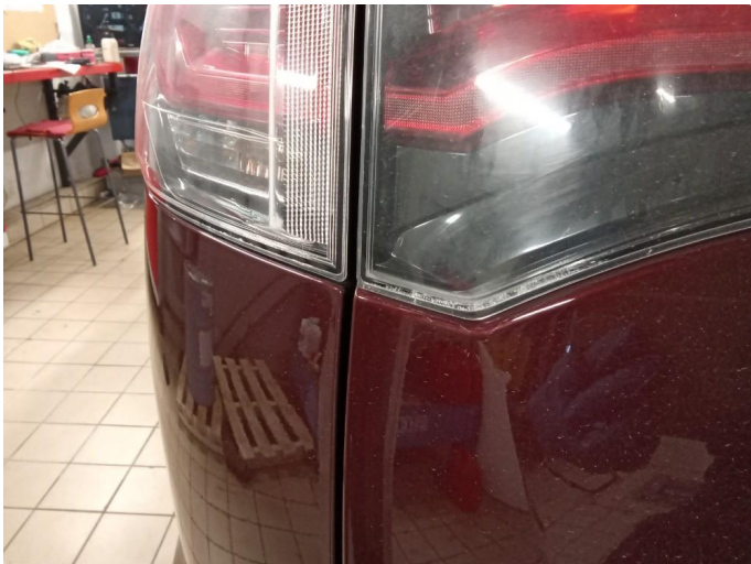
2.1 Krakelering i plast