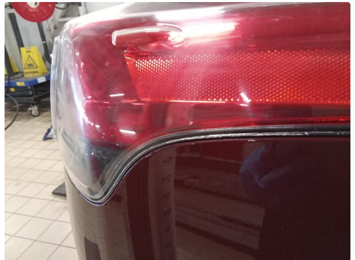
2.1 Krakelering i plast