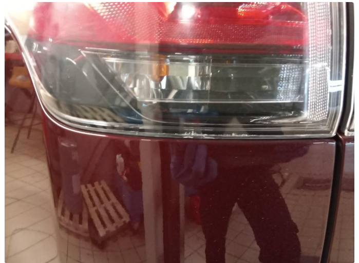
2.1 Krakelering i plast