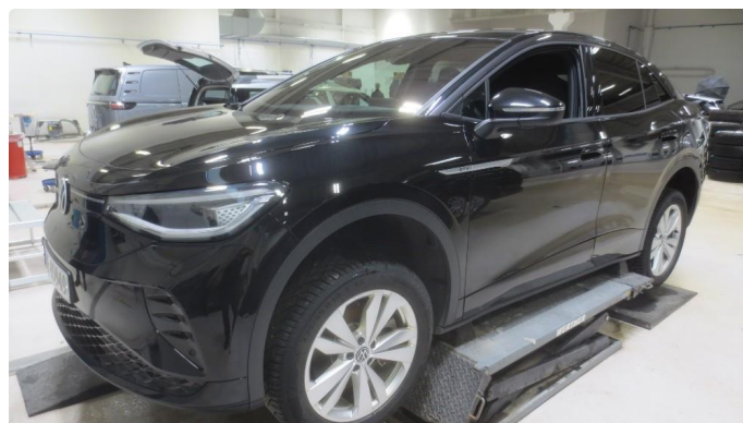
1.2 Emblemer på forskjermer og dører har løsnet - Skal utbedres