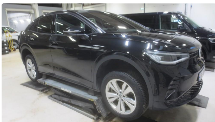
1.2 Emblemer på forskjermer og dører har løsnet - Skal utbedres