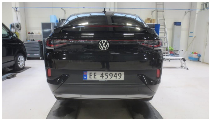
2.1 Lyslist på bakluke er noe løs - Skal utbedres