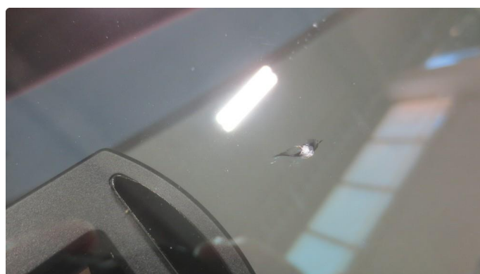
1.3 Steinsprut med sprekk frontrute - Skal utbedres