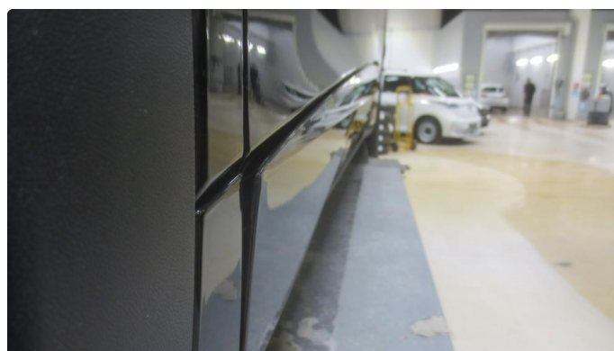
1.1 Framdørslister har løsnet i forkant (teipen har sluppet fra dørene) - Skal utbedres