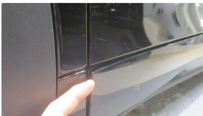
1.1 Framdørslister har løsnet i forkant (teipen har sluppet fra dørene) - Skal utbedres