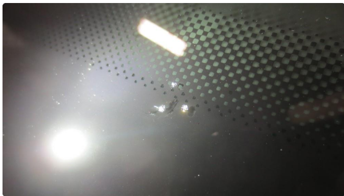
1.3 Steinsprut med sprekk frontrute - Skal utbedres