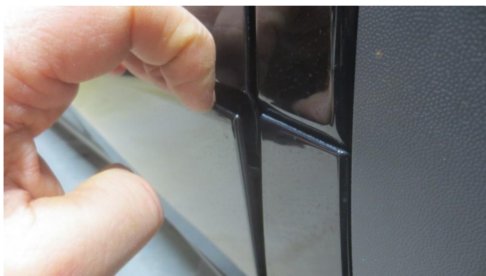
1.1 Framdørslister har løsnet i forkant (teipen har sluppet fra dørene) - Skal utbedres