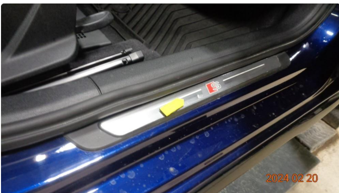
1.3 Liten bult innstegslist høyre fordør - OK