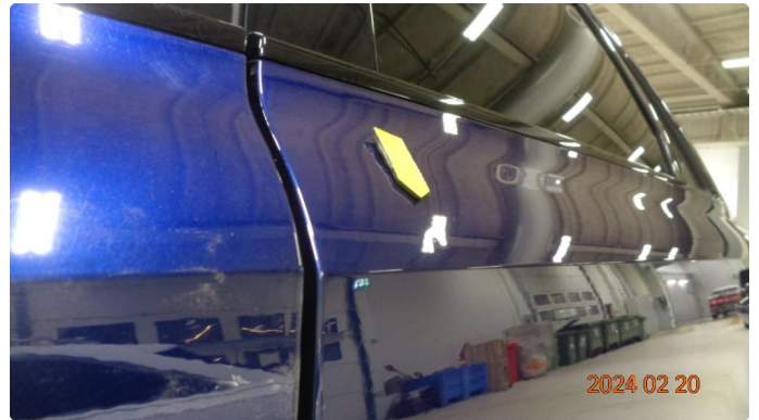
1.1 Parkeringsbult venstre bakdør - Skal utbedres