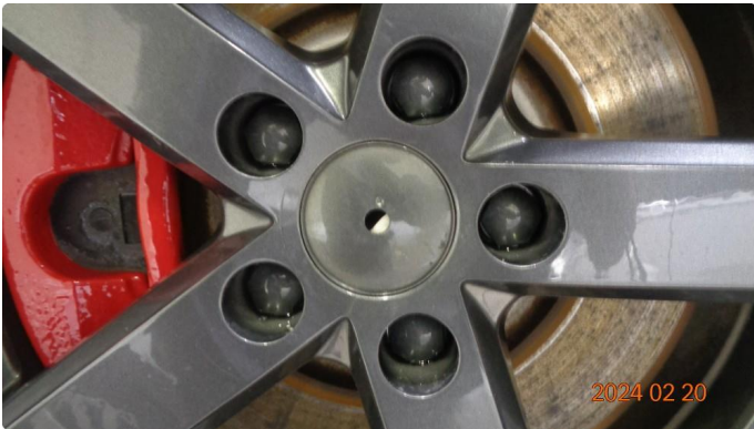
1.2 Merkelapp til senterkopp vinterfelg er borte - OK