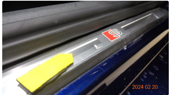
1.3 Liten bult innstegslist høyre fordør - OK