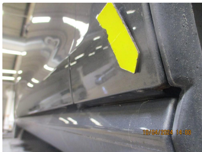
1.7 Lakkskader med lakkrust etter steinslag nedre/bakre del av begge forskjermene