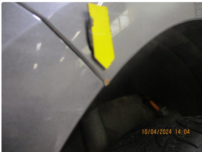
1.8 Lakkrust på bakskjermer mot fangerkappen og hjulbe fremre del etter steinslag