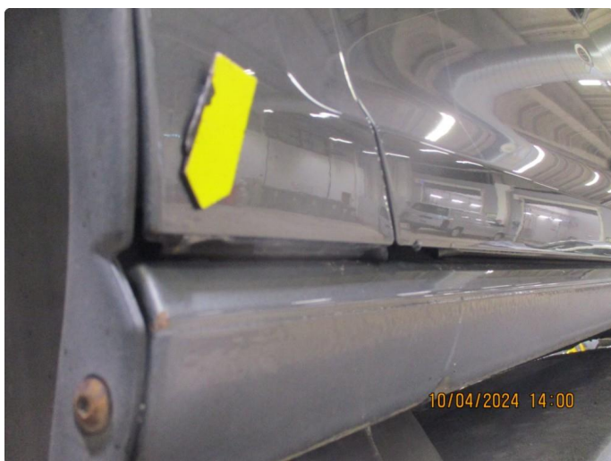
1.7 Lakkskader med lakkrust etter steinslag nedre/bakre del av begge forskjermene