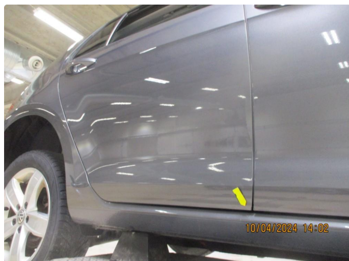
1.4 Sår i lakk med lakkkrust nedre del alle dører