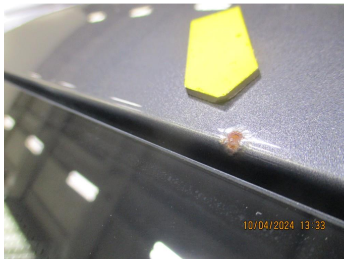
1.14 Steinsprut med rust på tak