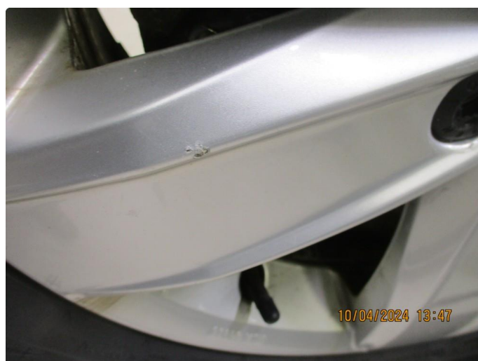
1.10 Kosmetiske skader på 1stk vinterfelg