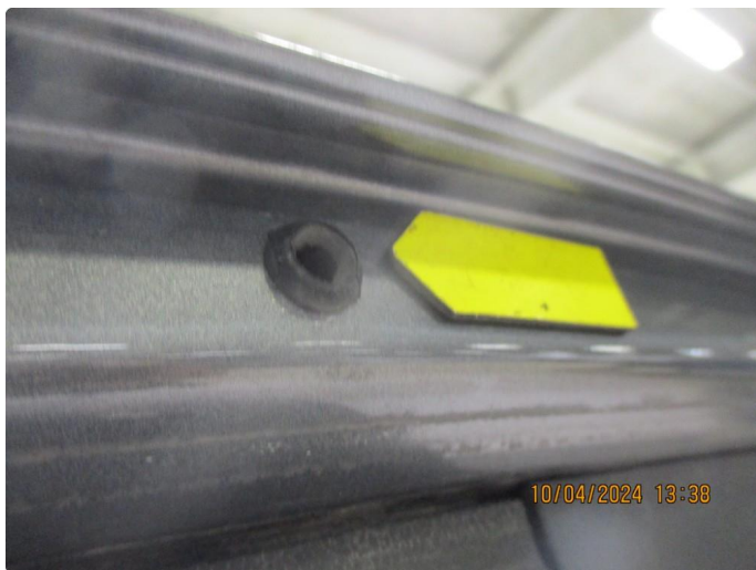
1.6 Lakkrust ved gummitopp på bakluke