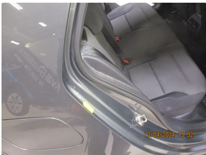
1.12 Gnisseskade med lakkrust begge bakdører