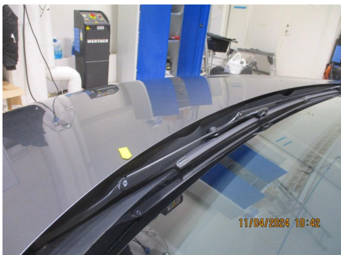
1.3 Sår i bakkant panser