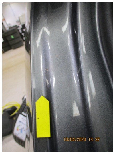
1.12 Gnisseskade med lakkrust begge bakkdører