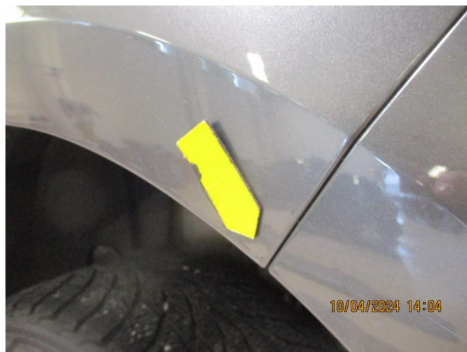
1.8 Lakkrust på bakskjermer mot fangerkappen og hjulbe fremre del etter steinslag