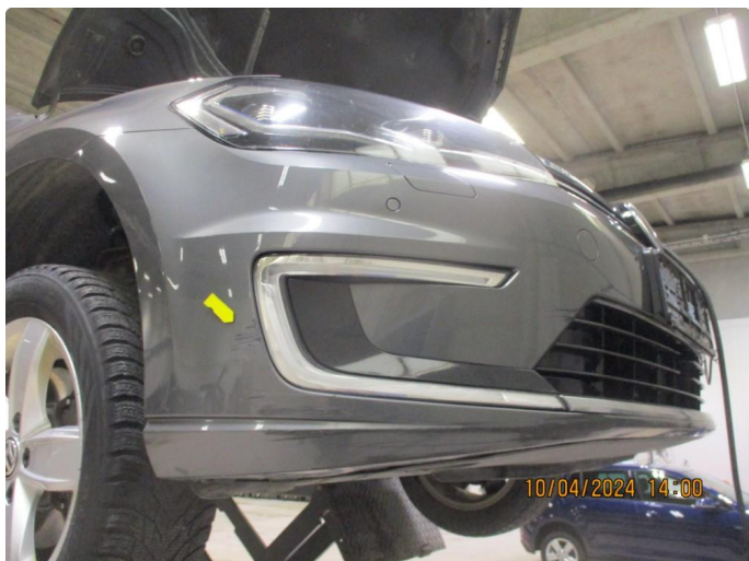
1.13 Støtfanger foran høyre side er oppskrapet