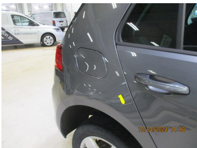
1.9 Liten bulk høyre bakskjerm