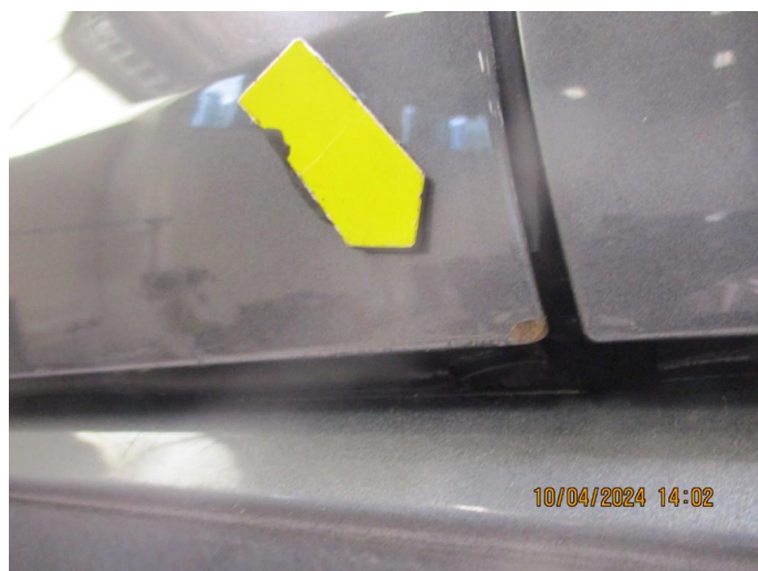
1.4 Sår i lakk med lakkkrust nedre del alle dører