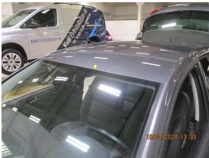
1.14 Steinsprut med rust på tak