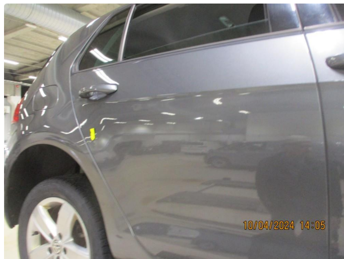
1.5 Kvass bulk høyre bakdør