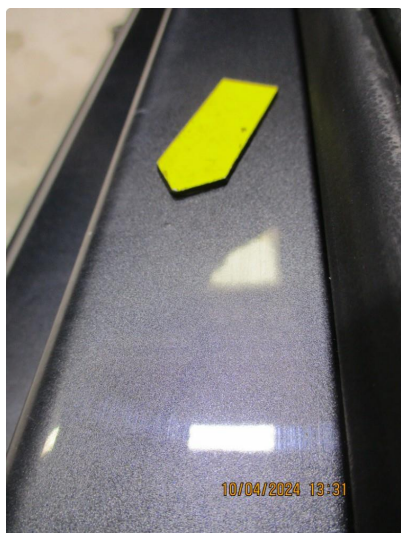
1.11 Rustblærer innsteg til venstre fordør