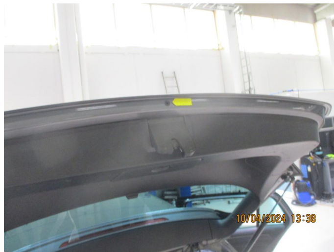
1.6 Lakkrust ved gummitopp på bakluke