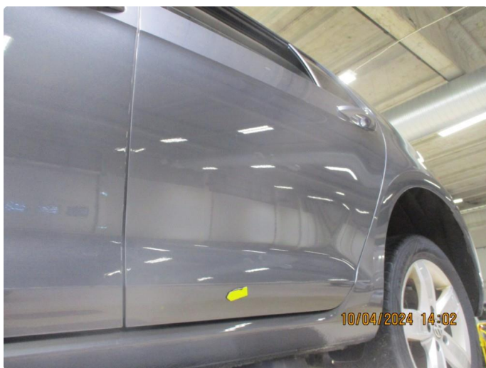
1.4 Sår i lakk med lakkrust nedre del alle dører