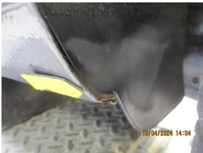
1.8 Lakkrust på bakskjermer mot fangerkappen og hjulbe fremre del etter steinslag