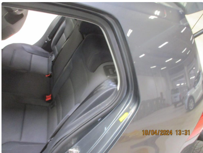
1.12 Gnisseskade med lakkrust begge bakdører