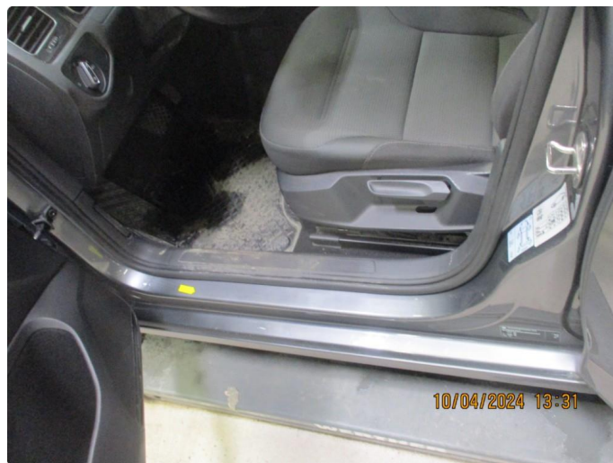
1.11 Rustblærer innsteg til venstre fordør