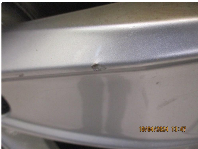
1.10 Kosmetiske skader på 1stk vinterfelg