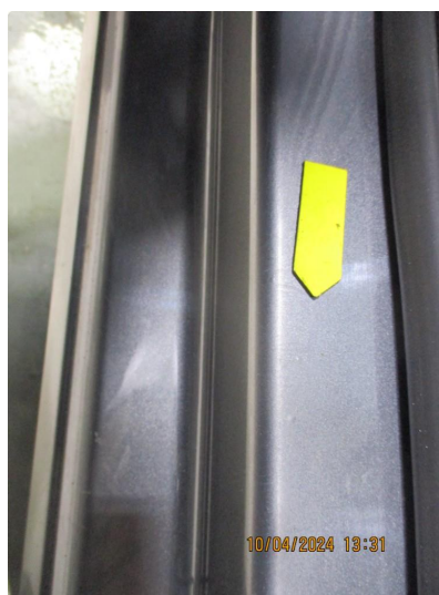
1.11 Rustblærer innsteg til venstre fordør