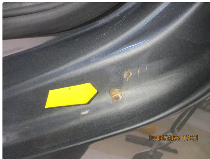
1.12 Gnisseskade med lakkrust begge bakdører