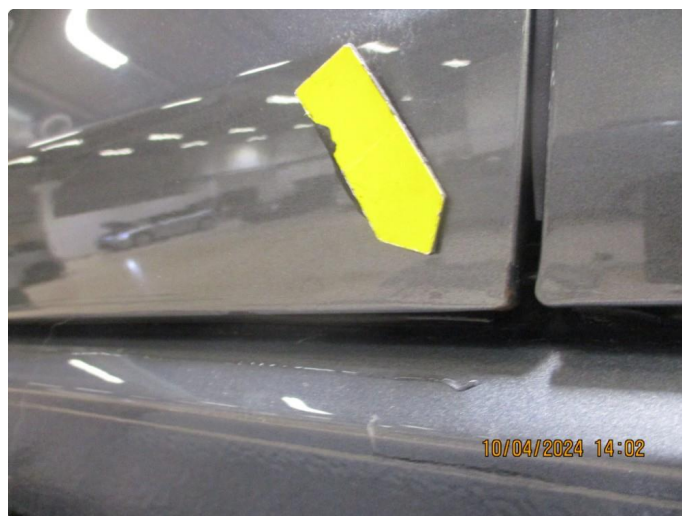
1.4 Sår i lakk med lakkrust nedre del alle dører