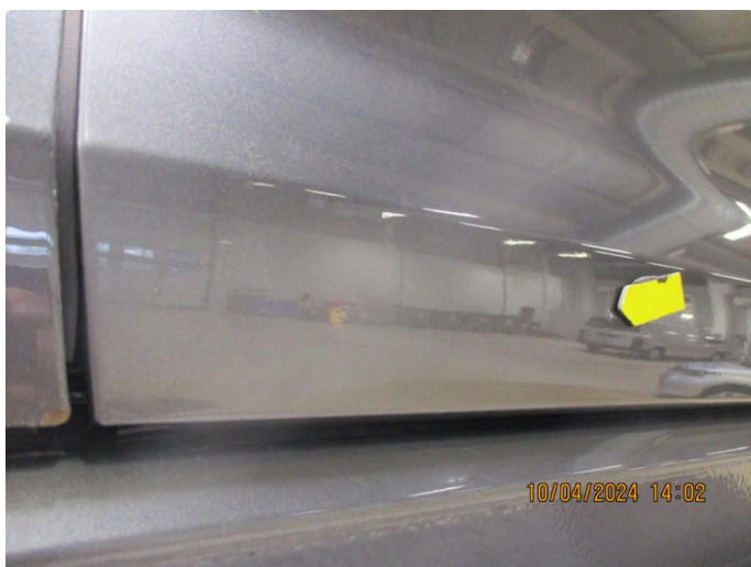
1.4 Sår i lakk med lakkrust nedre del alle dører