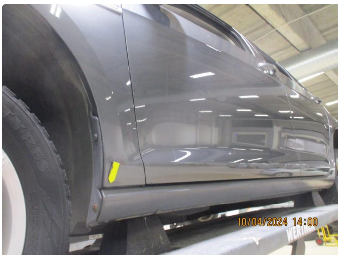
1.7 Lakkskader med lakkrust etter steinslag nedre/bakre del av begge forskjermene