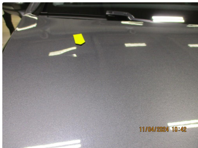
1.2 2 bulker på panser