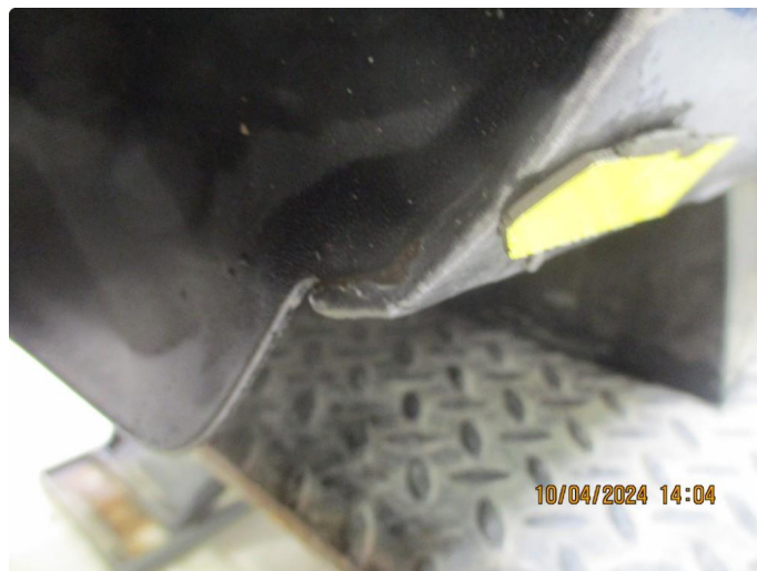
1.8 Lakkrust på bakskjermer mot fangerkappen og hjulbe fremre del etter steinslag