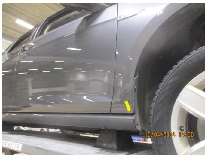
1.7 Lakkskader med lakkrust etter steinslag nedre/bakre del av begge forskjermene