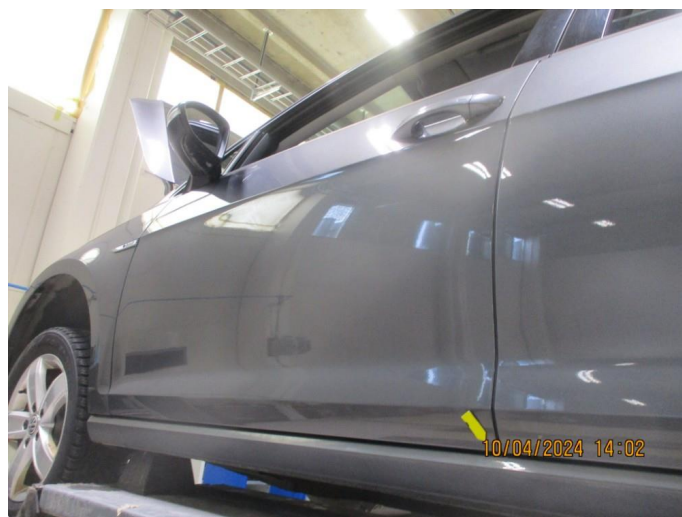
1.4 Sår i lakk med lakkrust nedre del alle dører