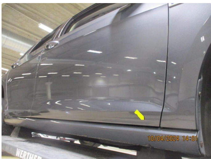
1.4 Sår i lakk med lakkkrust nedre del alle dører