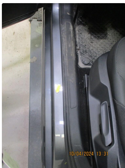
1.11 Rustblærer innsteg til venstre fordør