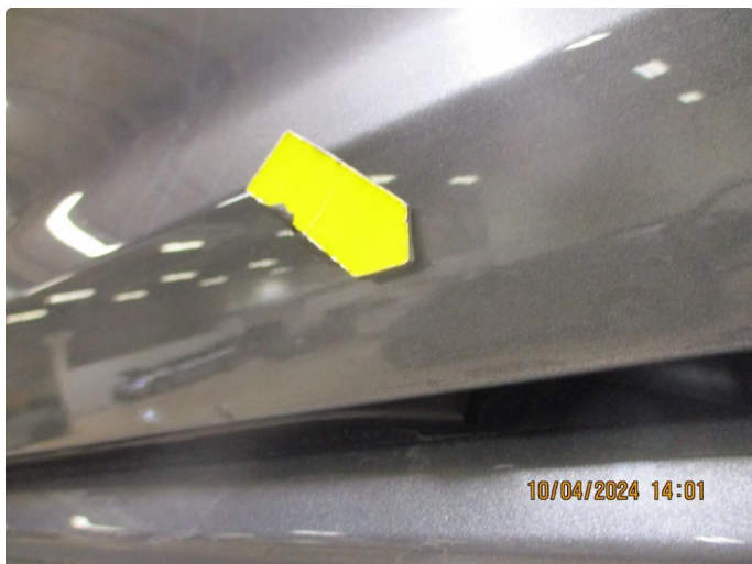
1.4 Sår i lakk med lakkrust nedre del alle dører