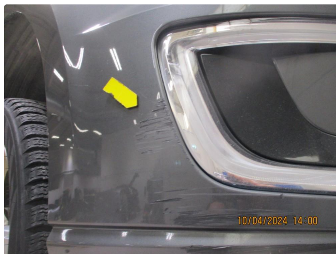
1.13 Støtfanger foran høyre side er oppskrapet