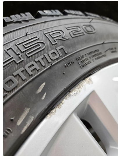
1.1 Skrubbermerke på en vinterfelg, blitt fylt m/lakk