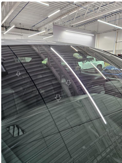
1.2 Noen små steinsprut utenfor synsfelt