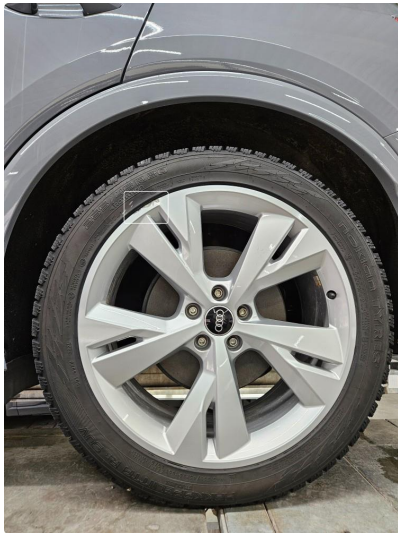
1.1 Skrubbermerke på en vinterfelg, blitt fylt m/lakk