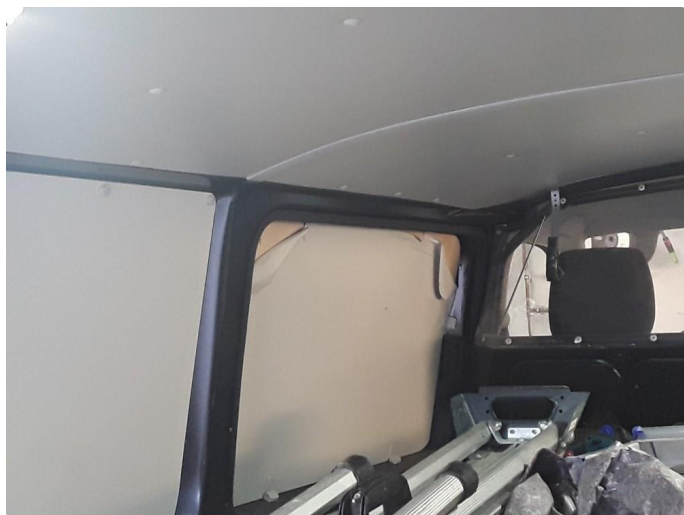
1.8 Øvrig opplysninger skade plater varerom