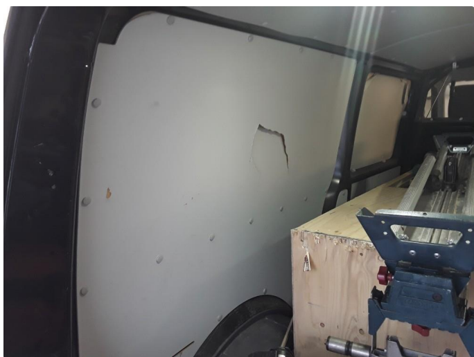
1.8 Øvrig opplysninger skade plater varerom