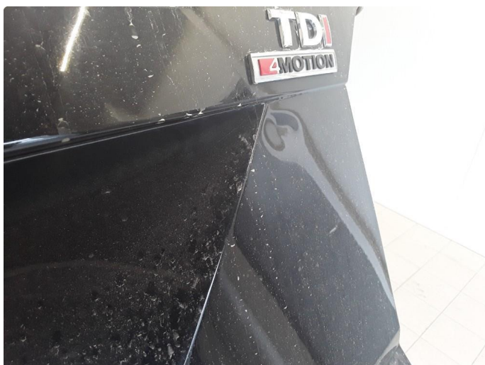
1.9 Øvrig opplysninger skader bakluke