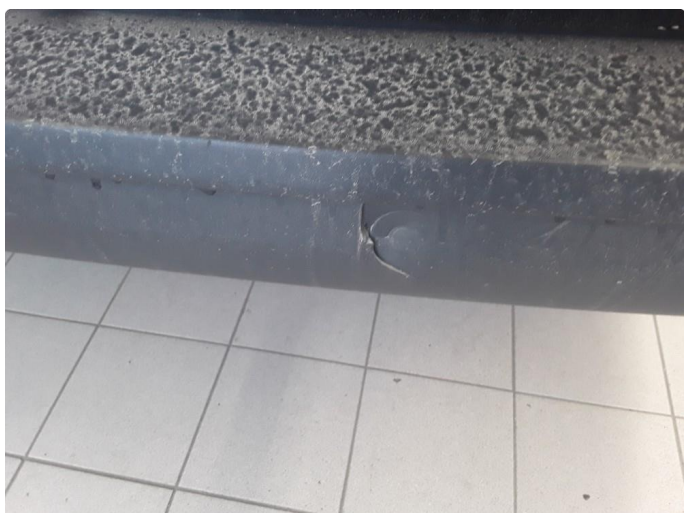
1.3 Øvrig opplysninger hull i støtfanger bak