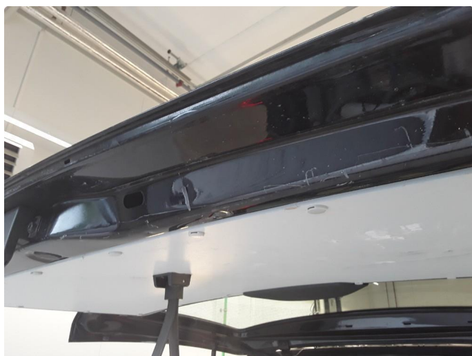
1.9 Øvrig opplysninger skader bakluke