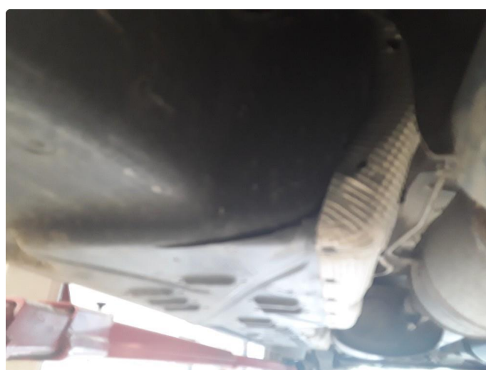
1.6 Øvrig opplysninger skader plater under bil