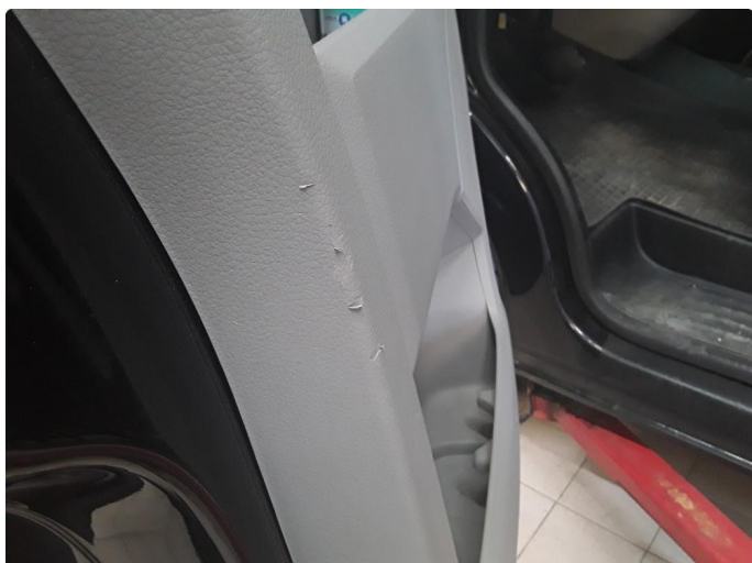
1.1 Øvrig opplysninger riper dørtrekk fører dør