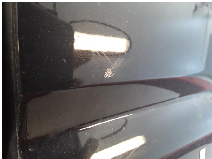
1.7 Øvrig opplysninger skade venstre skyvedør