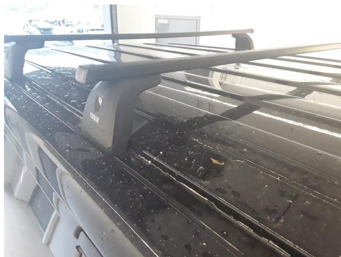
1.4 Øvrig opplysninger bulker i taket