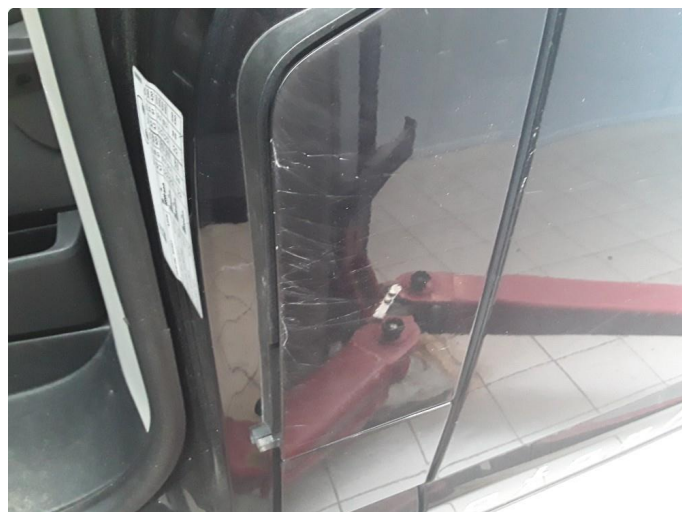
1.2 Øvrig opplysninger riper tanklokk