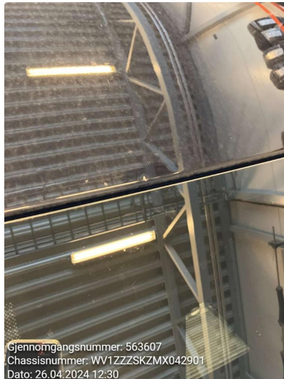
1.1 Generelt mye stensprut rundt om - penslet