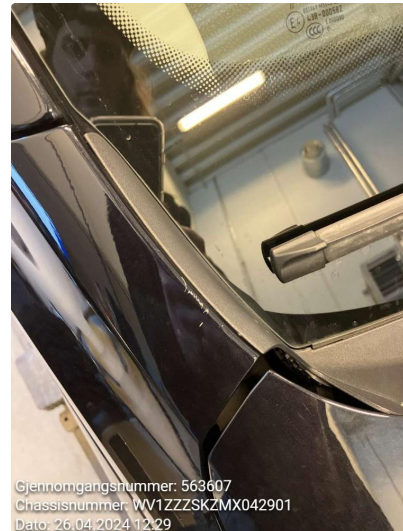
1.1 Generelt mye stensprut rundt om - penslet