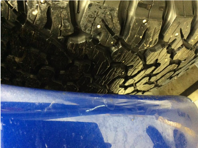
1.1 Skjermutbygger skadet