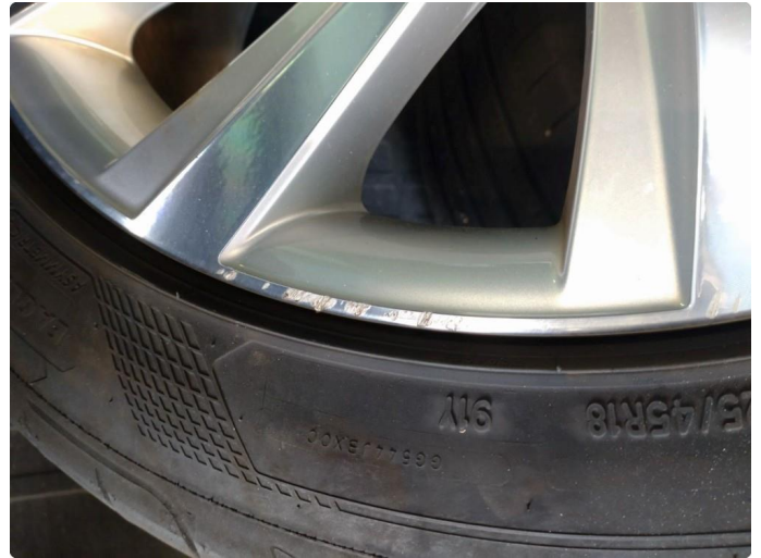
2.2 Kantkjørt felg