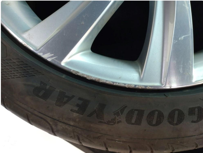
2.1 Kantkjørt felg