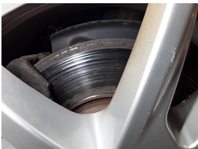
3.1 Rust på bremseskiver foran. Time bestilt. Byttes før levering.