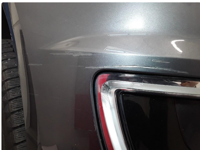
1.1 Ripe på støtfangerhjørne høyre side foran. Smartrep. utføres før levering.