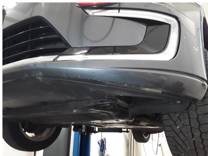
1.2 Noe skrubbskade underkant støtfanger foran. Normal bruksslitasje