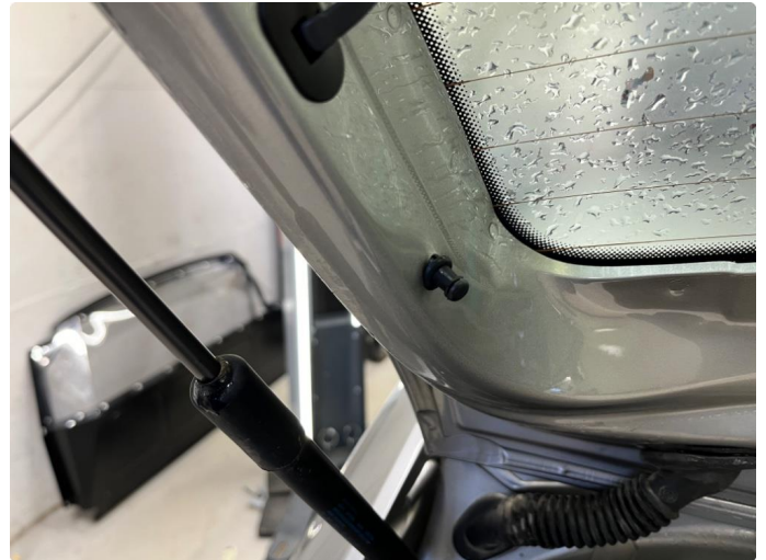
1.1 Liten bøy på tapp for hatthyllefeste.