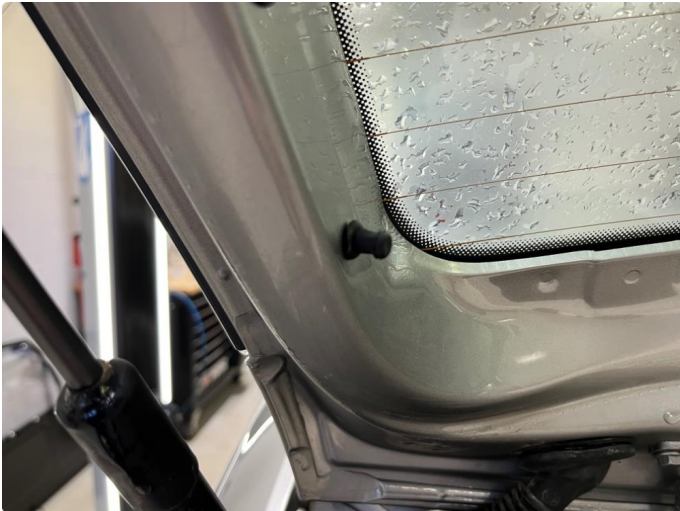
1.1 Liten bøy på tapp for hatthyllefeste.