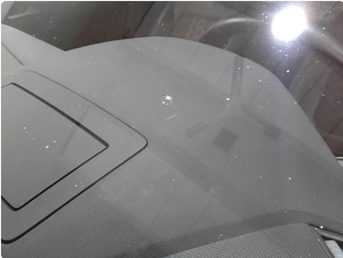
1.1 Slitt frontrute