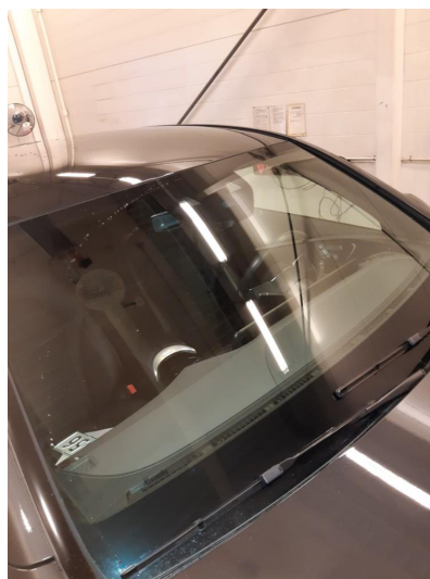
1.3 Bruksmerke på frontrute.