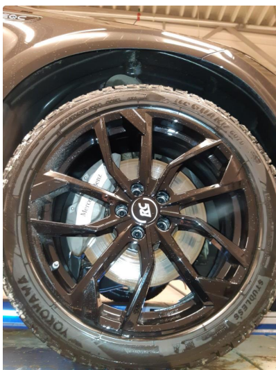
1.2 Ubetydelig bruksmerke på felgene.