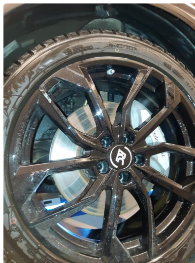
1.2 Ubetydelig bruksmerke på felgene.