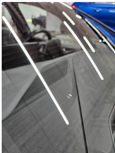
1.2 Steinsprut utenfor synsfelt, høyre midtre, de er blitt reparert/limt OK