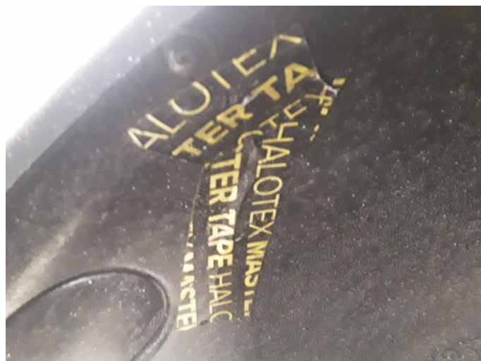
1.2 Plastinnerskjerm løs