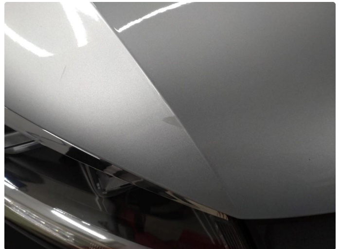
1.2 Bulk med lakkskade