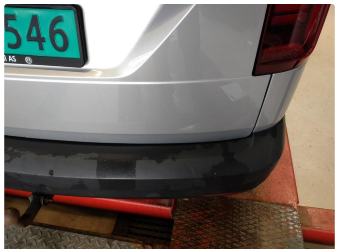
1.4 Noen riper