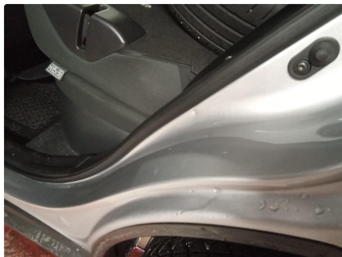
1.2 Noen riper og småbulker