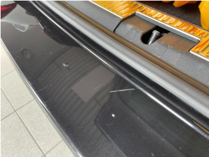
1.1 Ripe(r) og bruksmerker lastekant bagasjerom