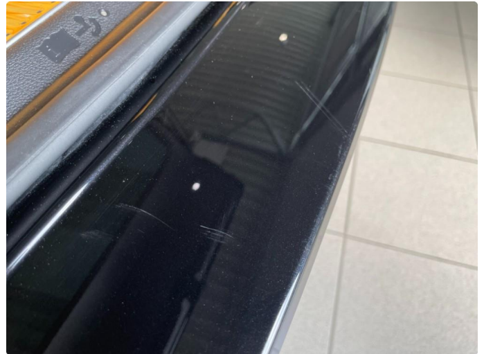
1.1 Ripe(r) og bruksmerker lastekant bagasjerom