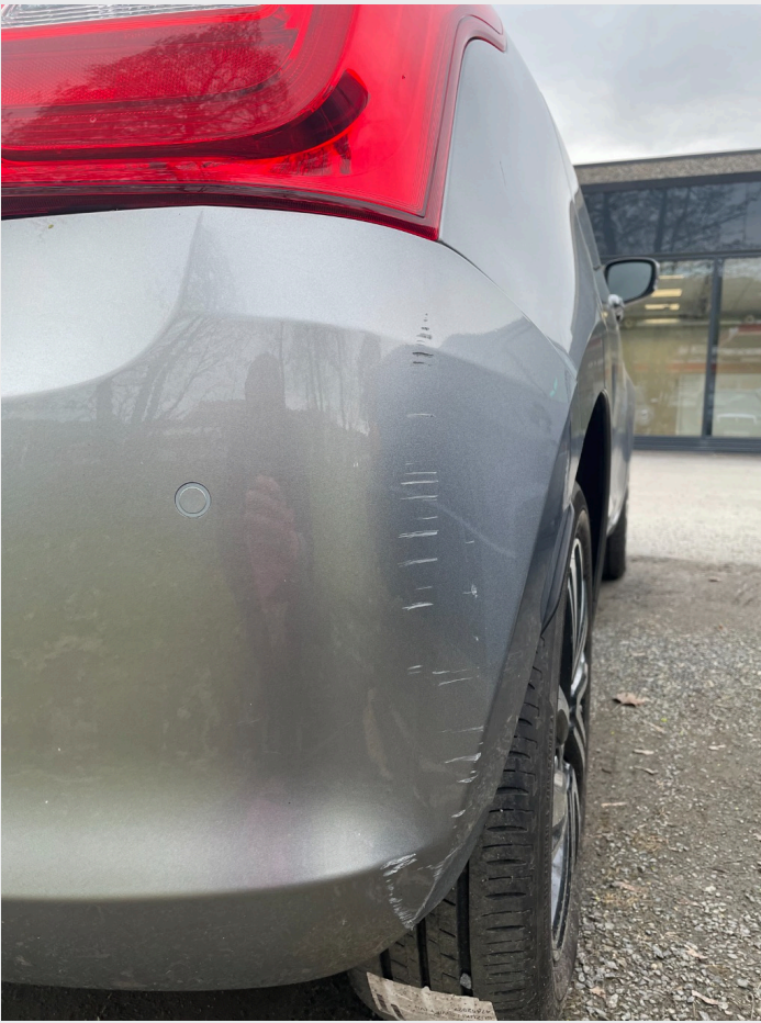
2.8 Riper støtfanger bak h.s.