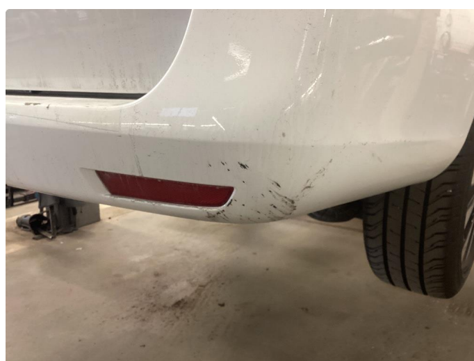
1.4 Riper som flekkes før levering begge fangerhjørner bak