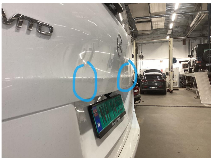
1.3 3 små parkbulker i bakluke