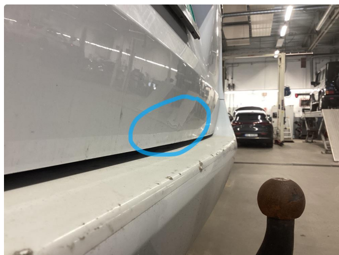
1.3 3 små parkbulker i bakluke