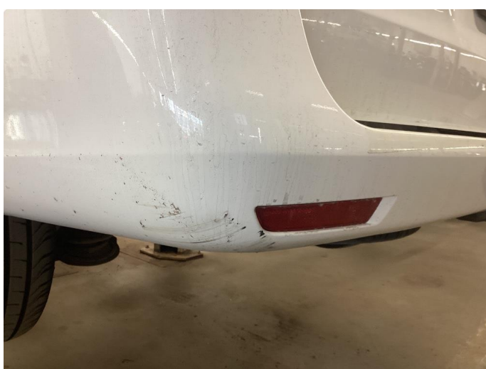
1.4 Riper som flekkes før levering begge fangerhjørner bak