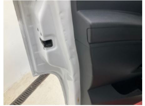
27. Lakk / karosseri utvendig