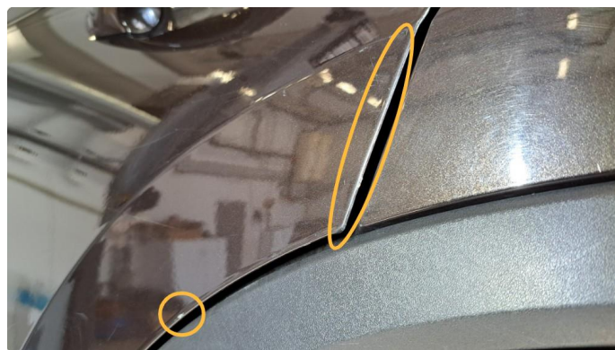
1.2 Bulk og riper