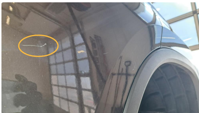
1.2 Bulk og riper