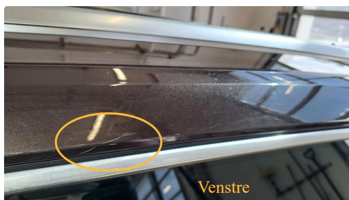
1.15 Riper på takvanger