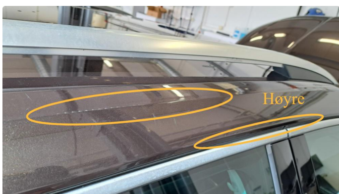
1.15 Riper på takvanger