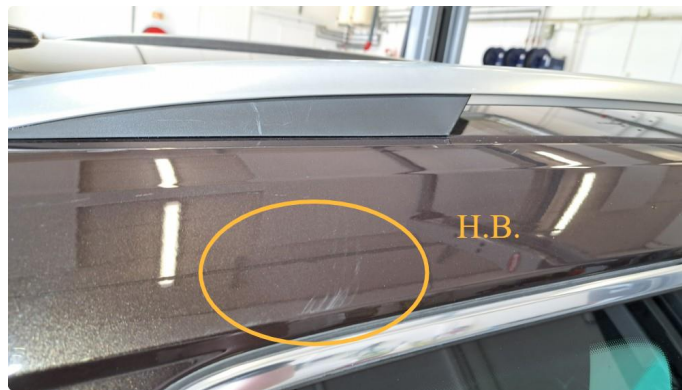
1.15 Riper på takvanger