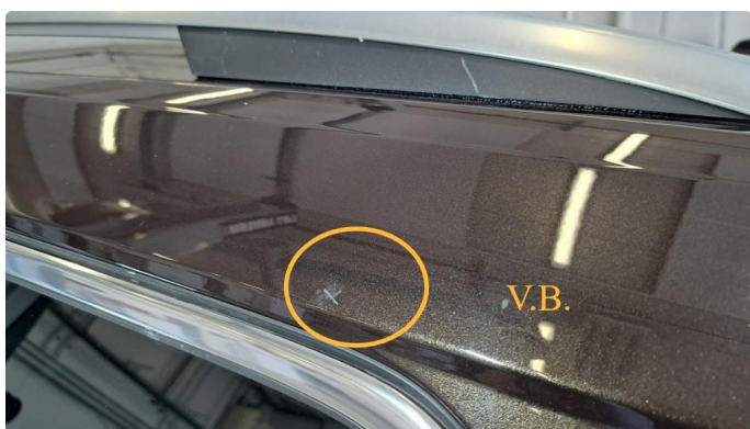
1.15 Riper på takvanger