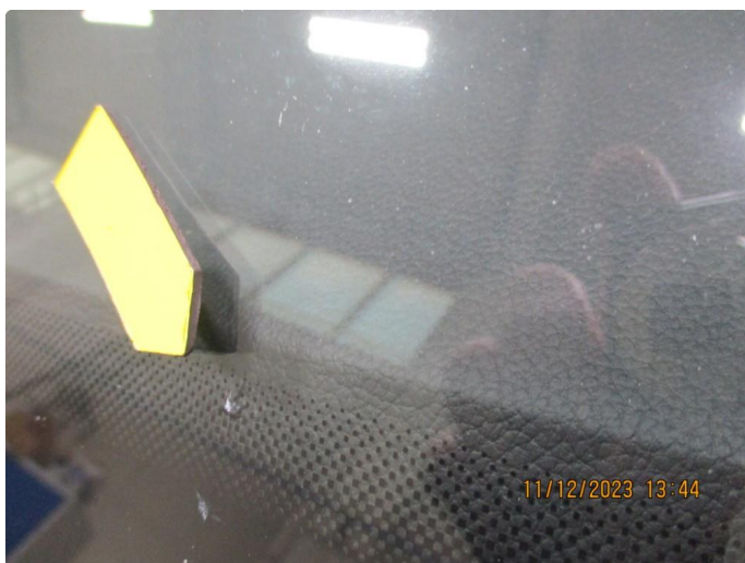
1.7 Steinsprut frontrute - repareres