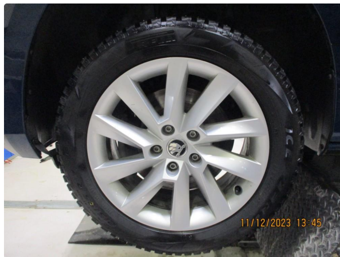
1.3 Kosmetisk skade vinterfelg