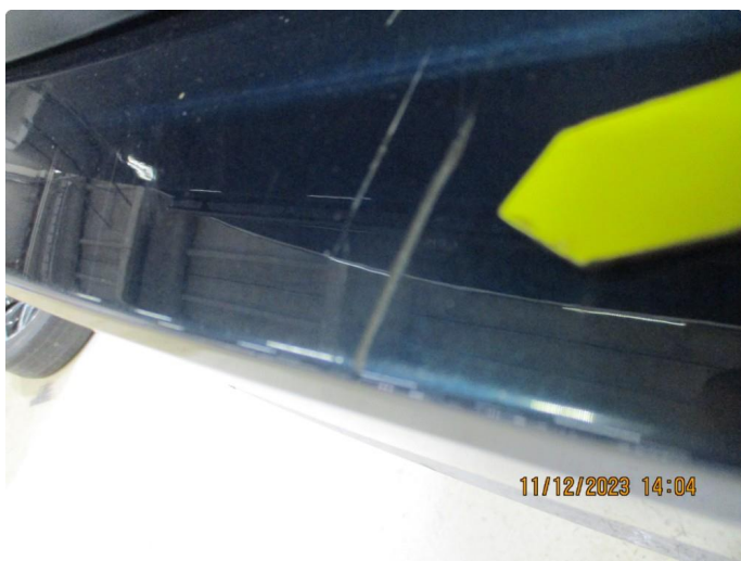
1.5 Riper gjennom lakk støtfanger bak - utbedres