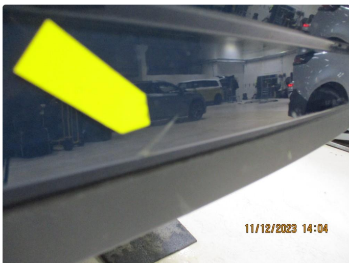
1.5 Riper gjennom lakk støtfanger bak - utbedres