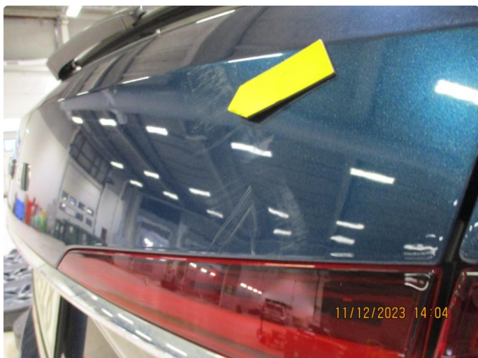
1.1 Bulk med lakkskade bakluke - utbedres