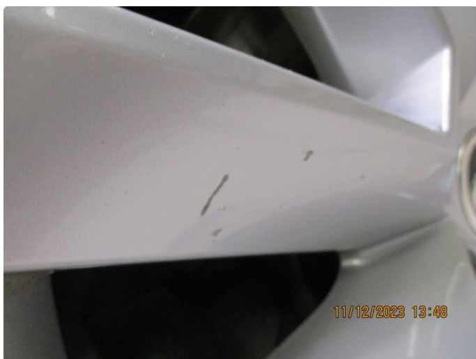
1.3 Kosmetisk skade vinterfelg