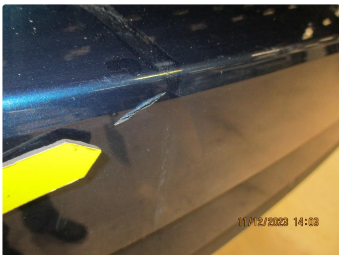
1.5 Riper gjennom lakk støtfanger bak - utbedres