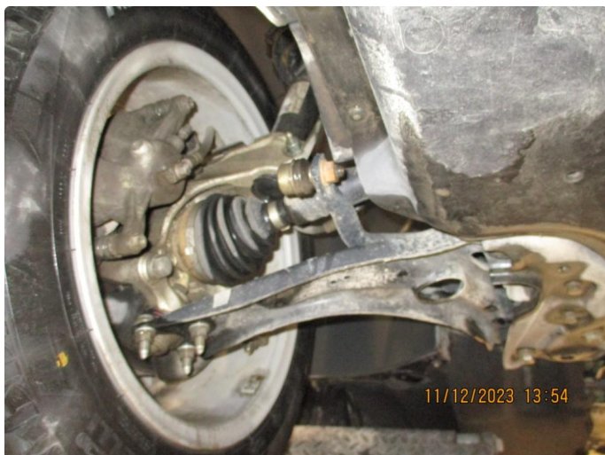
2.1 Slakke opphengskule høyre side - byttes