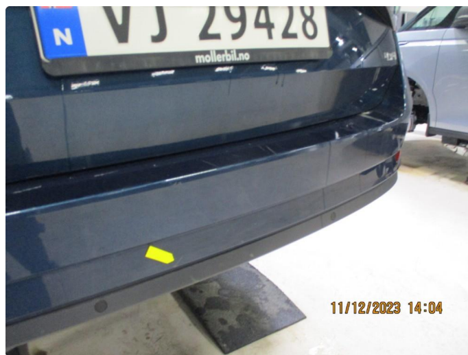
1.5 Riper gjennom lakk støtfanger bak - utbedres