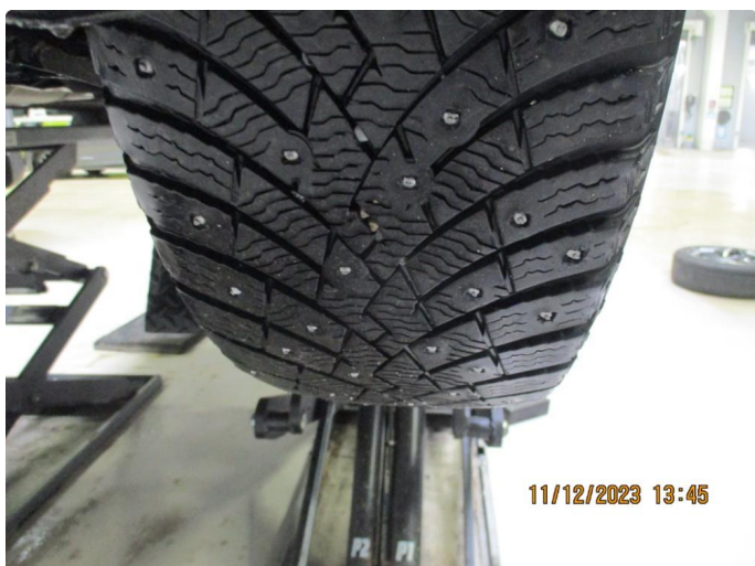
1.2 Slitte vinterdekk + trapping - 4 byttes