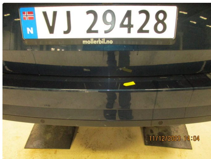
1.5 Riper gjennom lakk støtfanger bak - utbedres