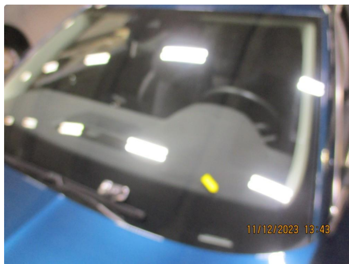
1.7 Steinsprut frontrute - repareres