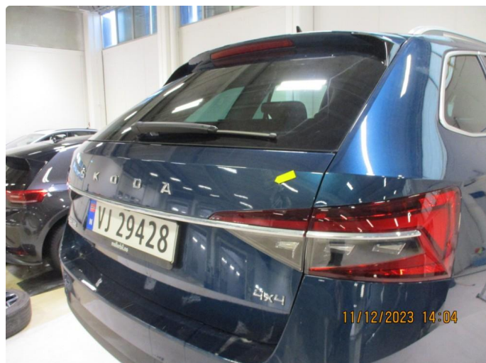
1.1 Bulk med lakkskade bakluke - utbedres