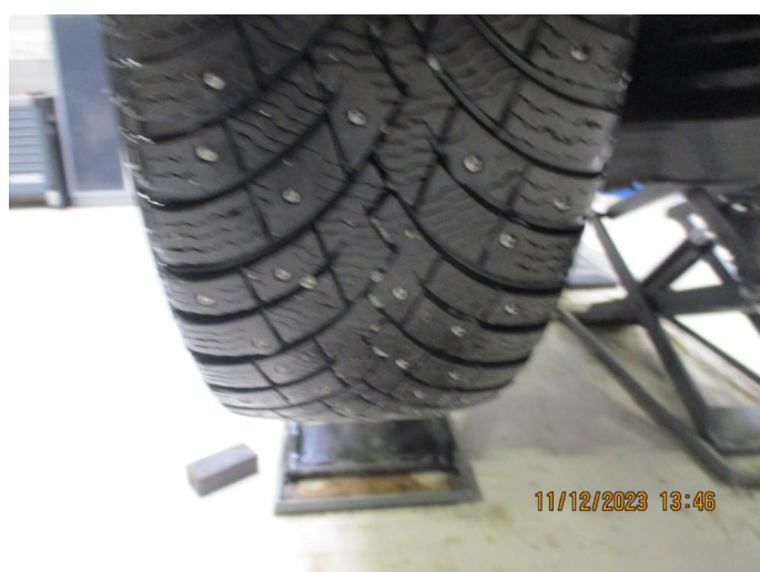
1.2 Slitte vinterdekk + trapping - 4 byttes