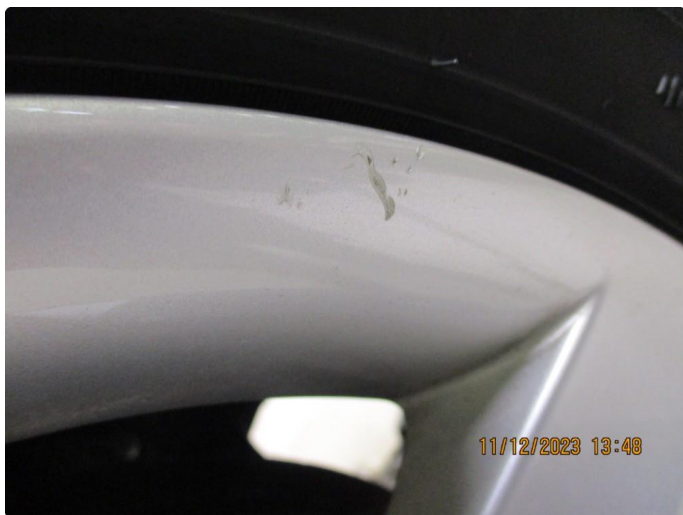
1.3 Kosmetisk skade vinterfelg