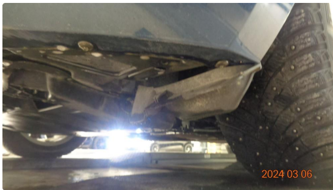
1.6 Skade støtfanger foran høyre side - utbedres