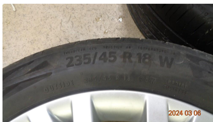
1.4 For liten mønsterdybde sommerdekk - 4 byttes