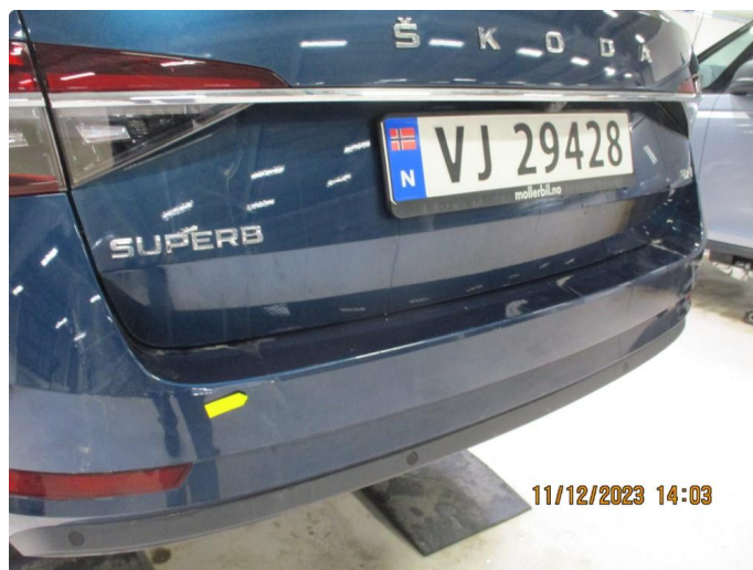
1.5 Riper gjennom lakk støtfanger bak - utbedres