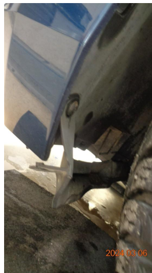
1.6 Skade støtfanger foran høyre side - utbedres