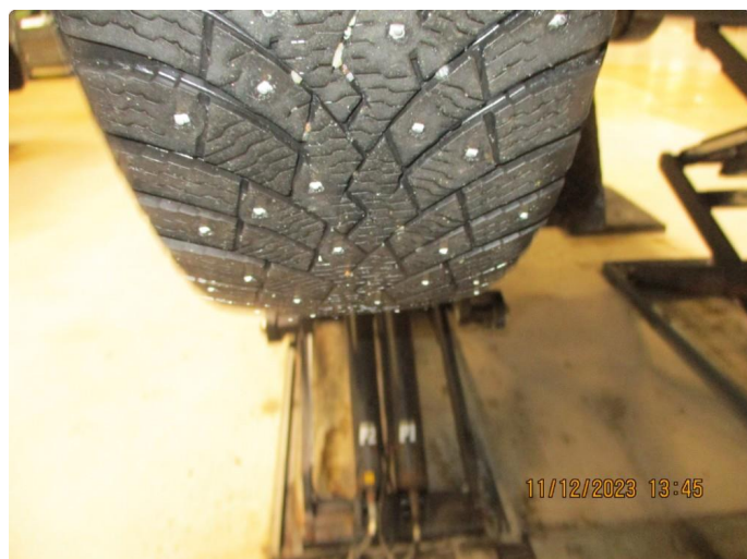
1.2 Slitte vinterdekk + trapping - 4 byttes