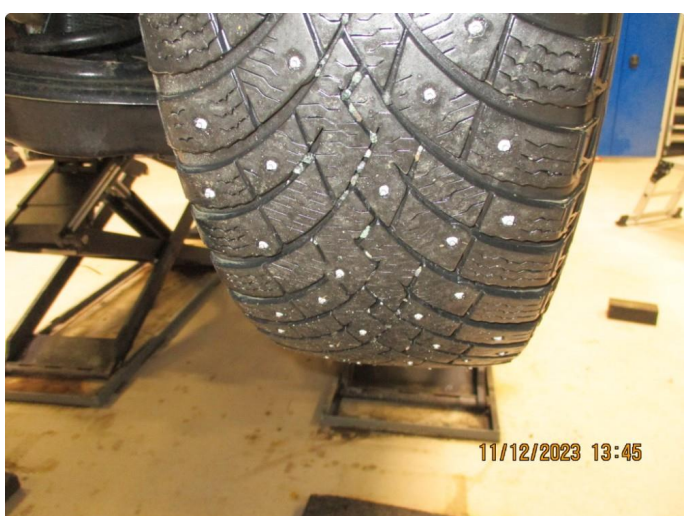
1.2 Slitte vinterdekk + trapping - 4 byttes