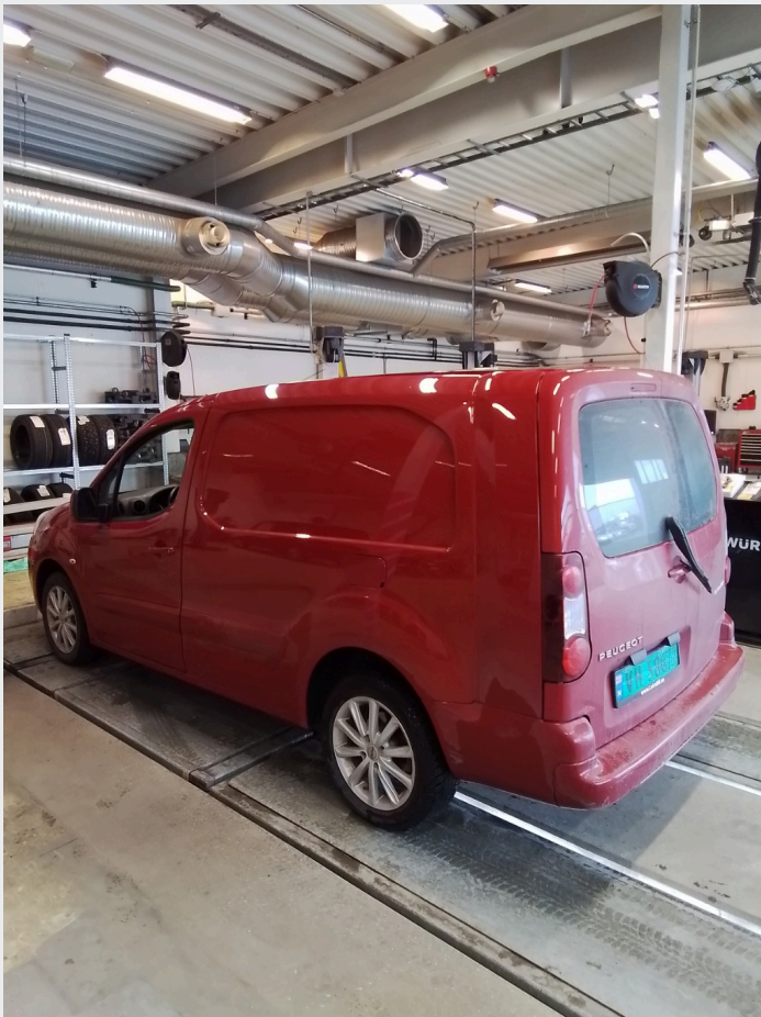
2.1 Generelt en del småskader og riper i lakk