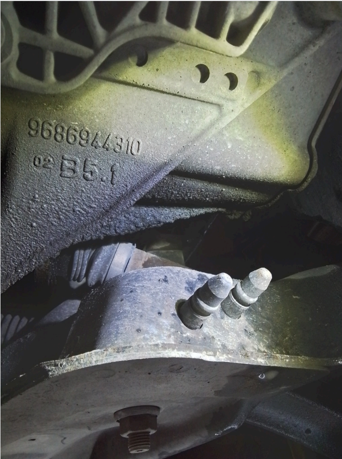
8.4 Oljesvetting utgående aksel høyre og venstre foran