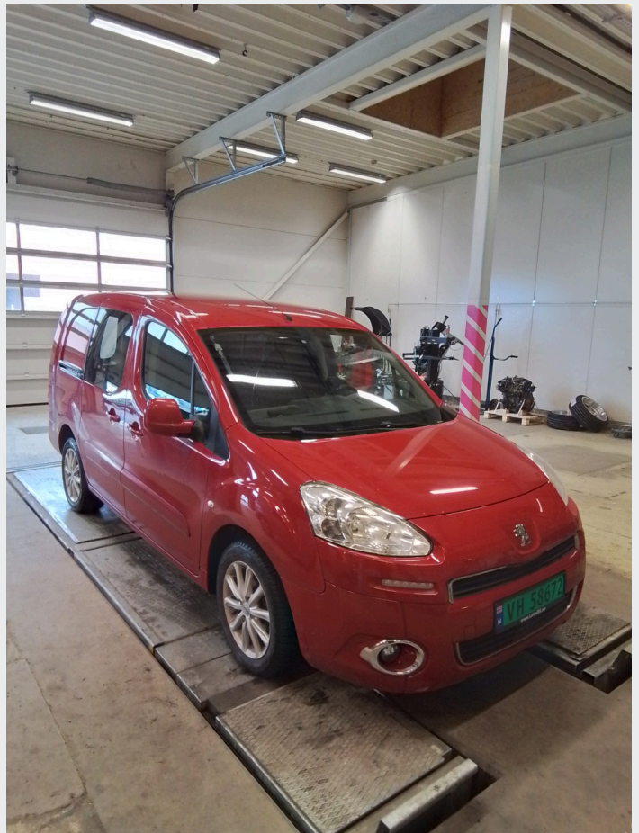
2.1 Generelt en del småskader og riper i lakk