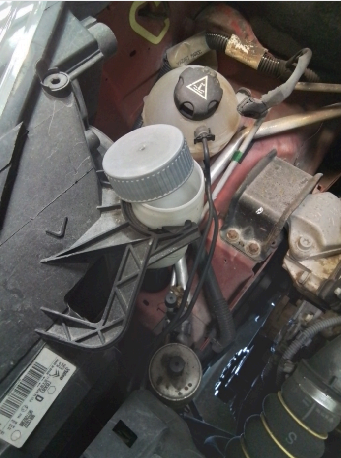
2.16 Topp over spylervæske er uoriginal. Dårlig passform