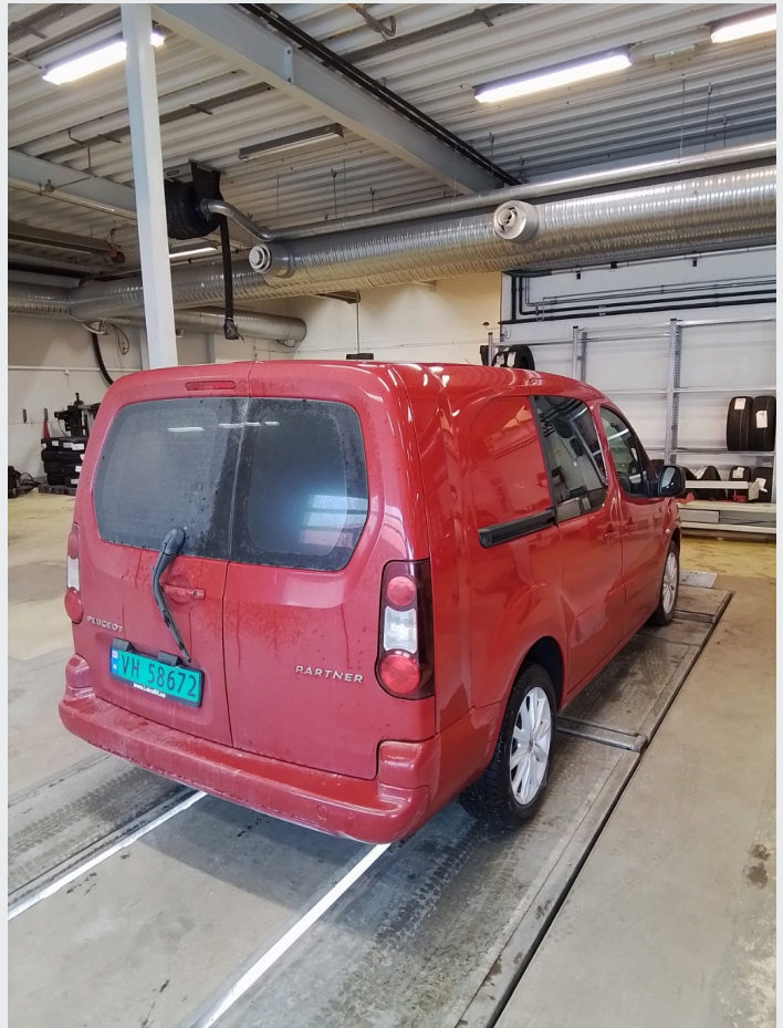
2.1 Generelt en del småskader og riper i lakk