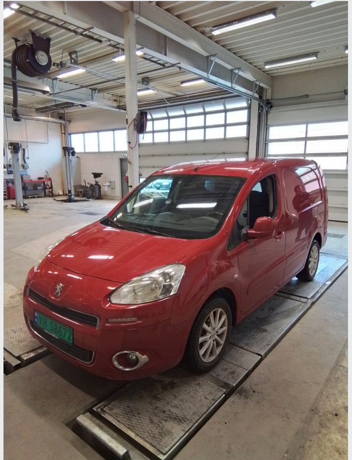
2.1 Generelt en del småskader og riper i lakk