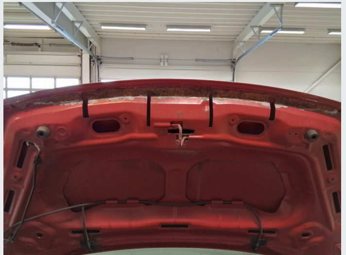
2.3 Rust underside panser