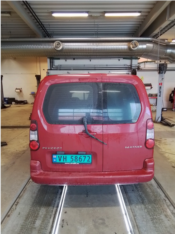
2.1 Generelt en del småskader og riper i lakk