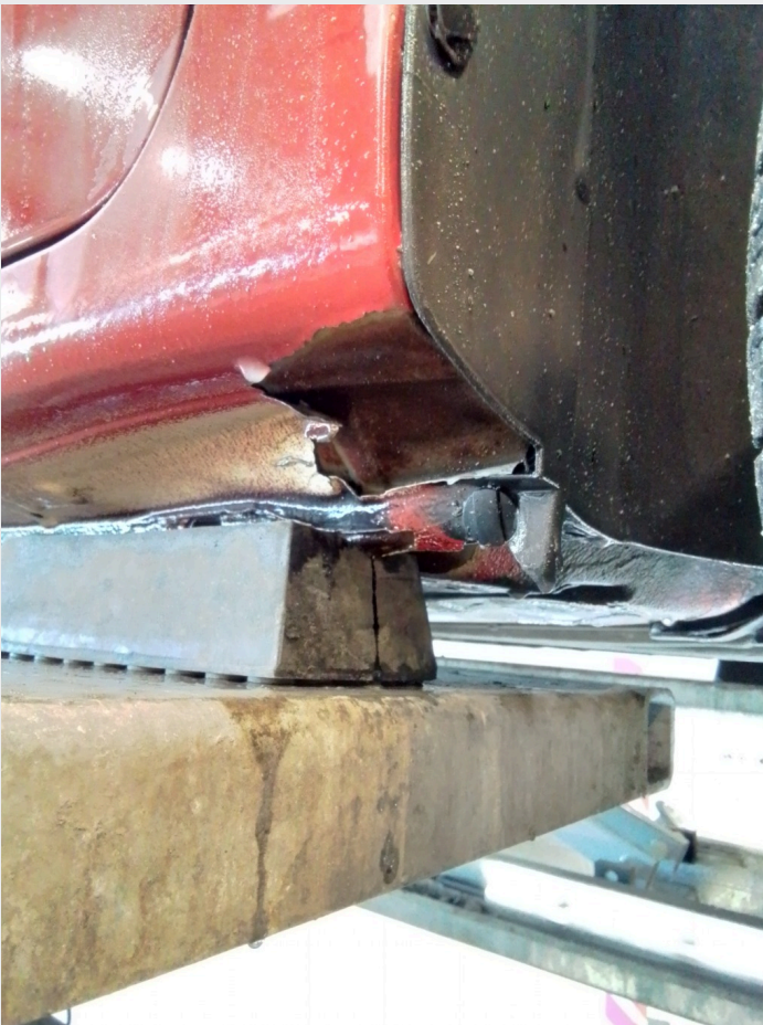
2.4 Bulk kanal høyre side