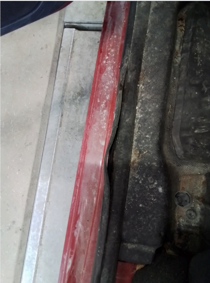
2.5 Dørpakning innsteg skadet