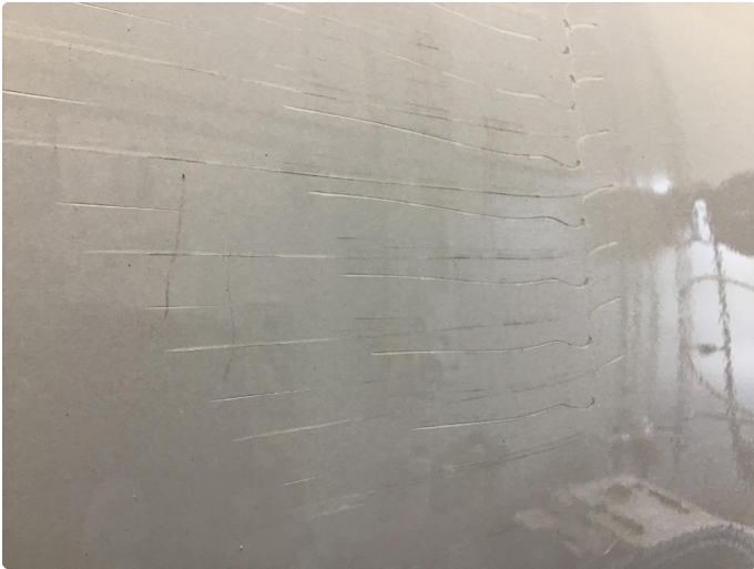
1.3 Ripe(r) ned til grunning