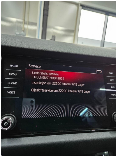
2.1 Service info OK