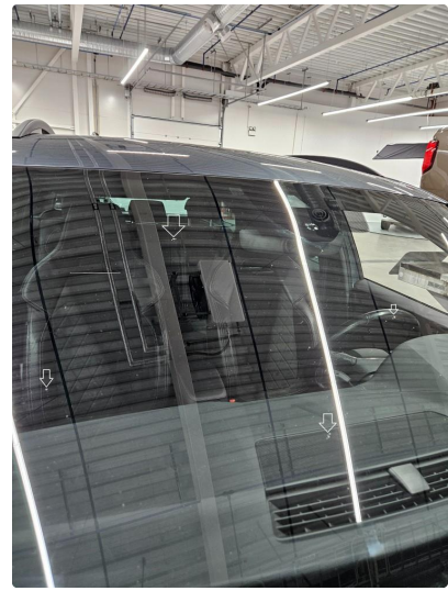
1.4 Noen steinsprut utenfor synsfelt, notert