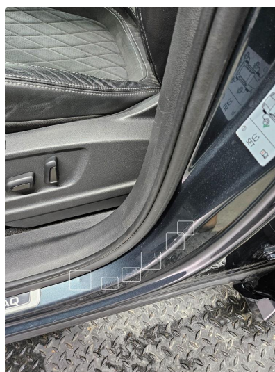
1.2 Noen riper og småbulker, v.side foran