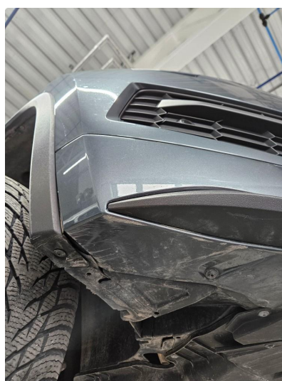
1.3 Skrubbemerker i plast, underkant h.side foran, notert