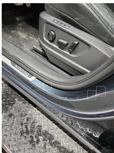
1.2 Noen riper og småbulker, v.side foran