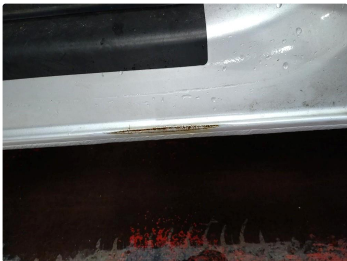
1.10 Slitt gjennom lakk