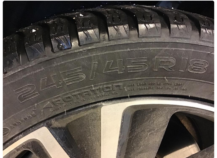
1.3 For lite mønsterdybde vinterdekk premium