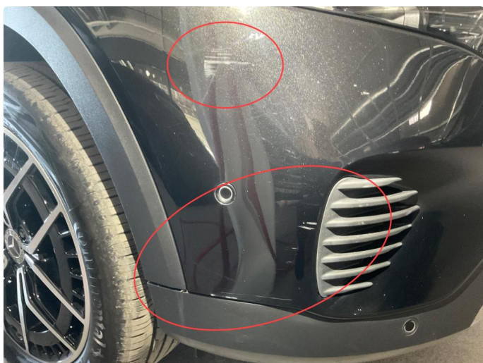
1.3 Ripe(r) ned til grunning