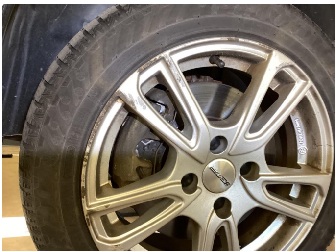
1.1 Kantkjørte vinterfelger