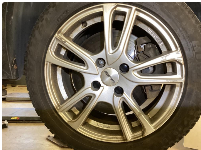
1.1 Kantkjørte vinterfelger