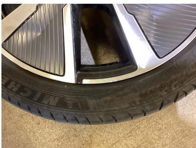
1.2 Kantkjørte sommerfelger