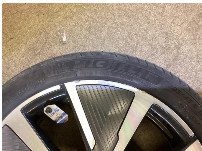
1.2 Kantkjørte sommerfelger