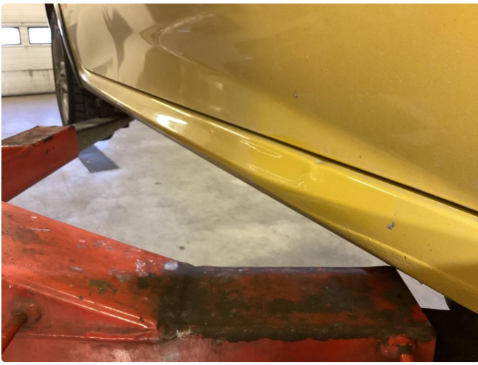
1.4 Liten bulk på kanal