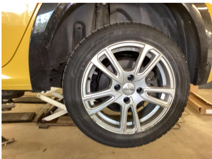
1.1 Kantkjørte vinterfelger