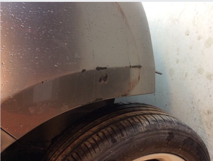
2.8 Skade h f