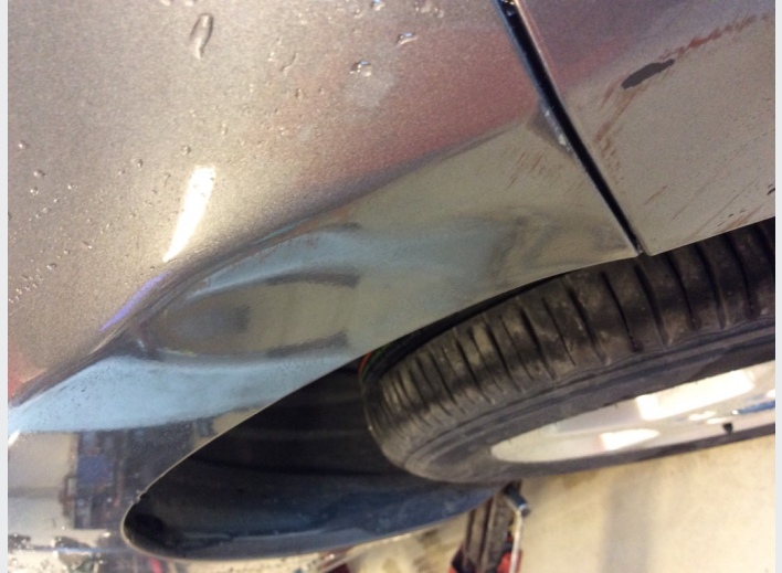
2.7 Skade h f