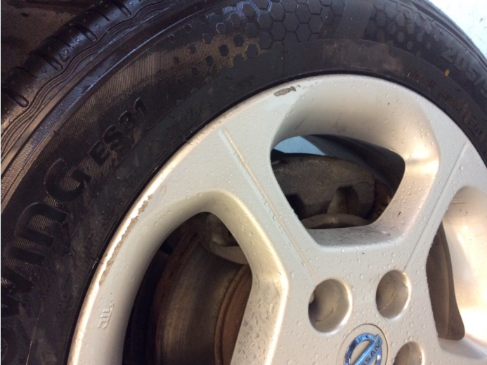
2.18 Litt kantkjørt h f.