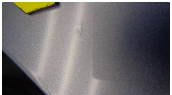
1.2 Urenhet i lakken høyre bakskjerm