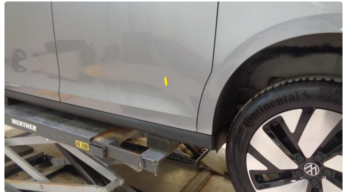
1.1 Steinsprut med lakkboble venstre skyvedør