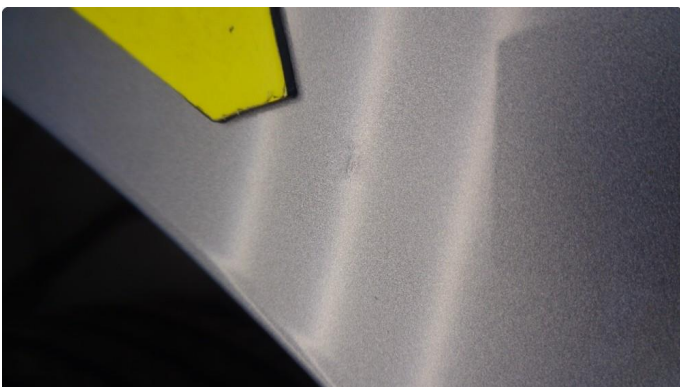
1.2 Urenhet i lakken høyre bakskjerm