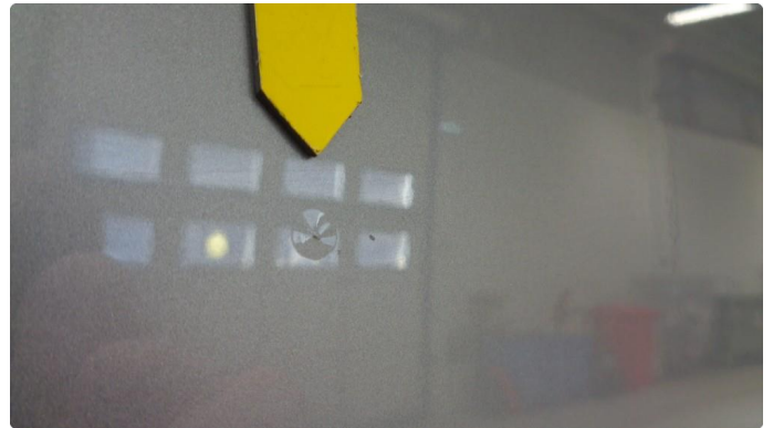
1.1 Steinsprut med lakkboble venstre skyvedør