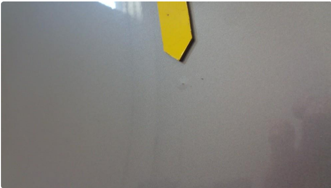
1.1 Steinsprut med lakkboble venstre skyvedør