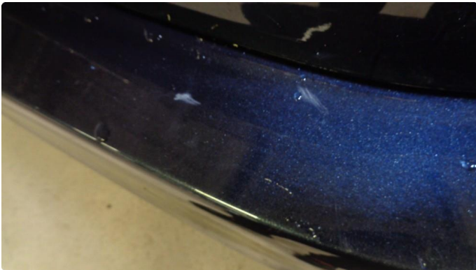
1.1 Riper og småsår innlastingssone bakfanger.