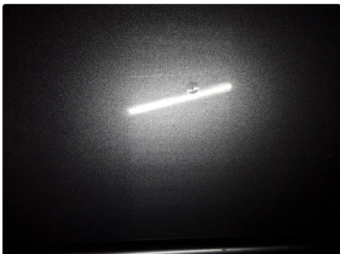
1.2 Steinsprut med korrosjon høyre skyvedør.