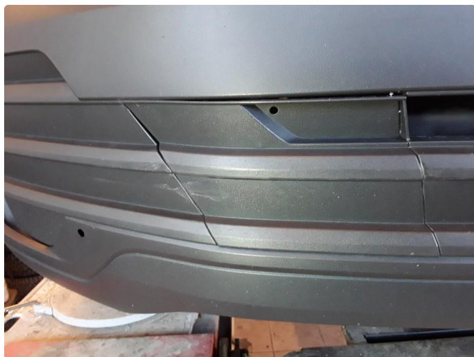
1.5 Noe riper på støtfanger foran.