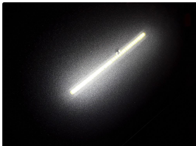
1.3 Steinsprut med korrosjon bakluke.