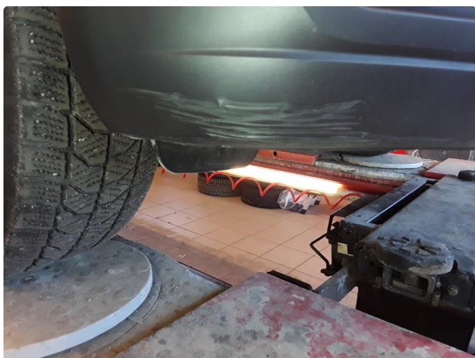
1.5 Noe riper på støtfanger foran.