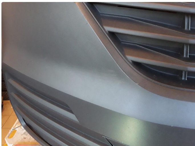
1.5 Noe riper på støtfanger foran.