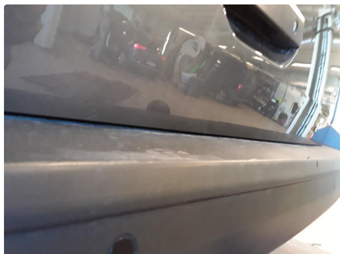
1.3 Steinsprut med korrosjon bakluke.