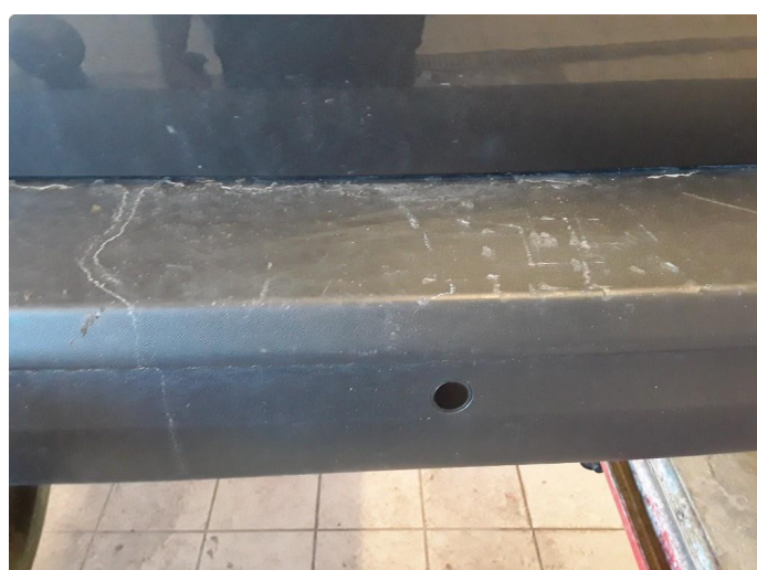
1.4 Noe riper på støtfanger bak.