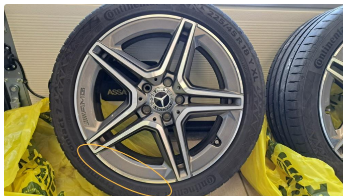
1.3 Kantkjørt / riper i to sommerfelger.