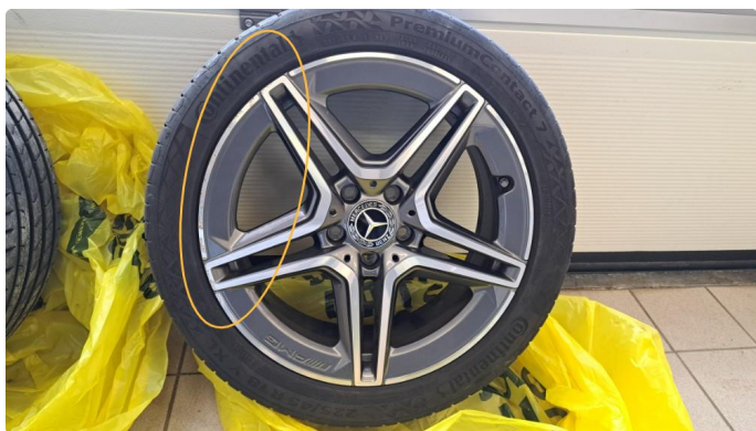
1.3 Kantkjørt / riper i to sommerfelger.