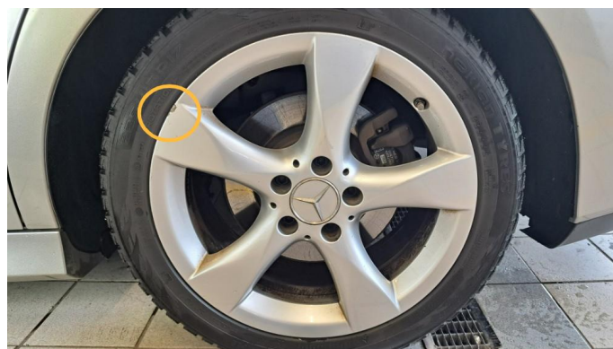
1.4 Kantkjørt felg to vinterhjul.