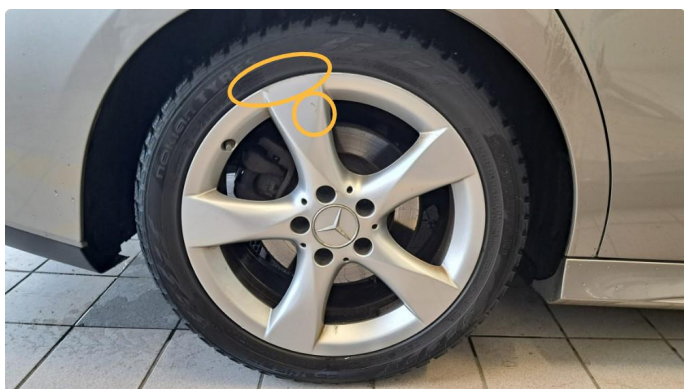
1.4 Kantkjørt felg to vinterhjul.