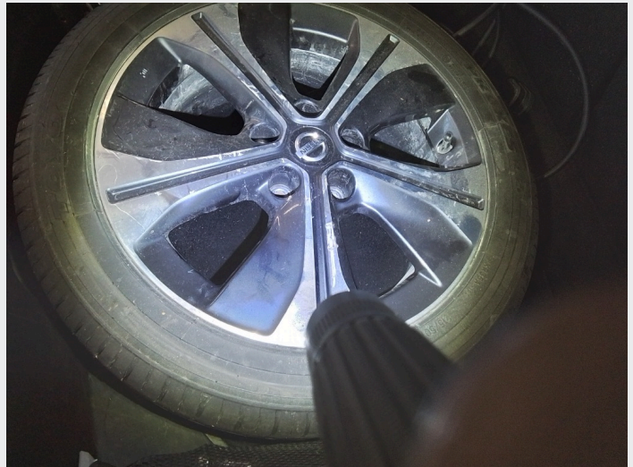
2.18 Kantkjørt på sommerfelger