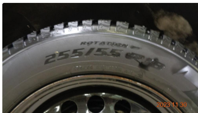
1.1 2 nye piggdekk