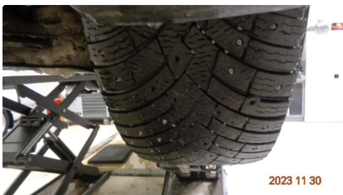
1.1 2 nye piggdekk