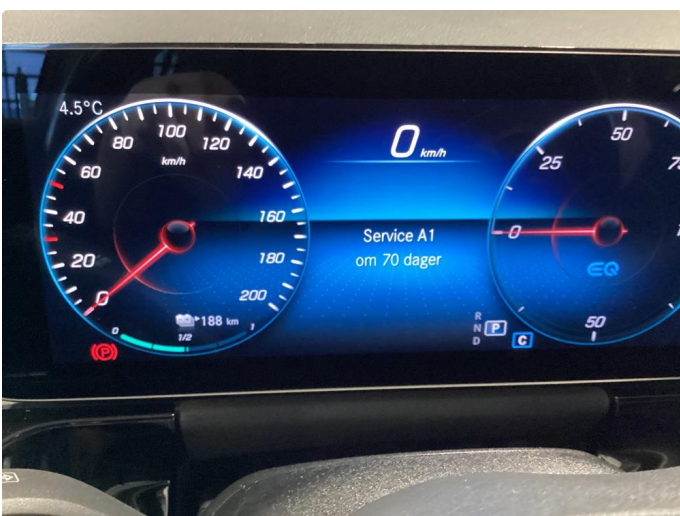
2.1 Trenger service