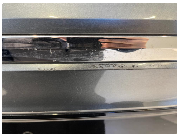
1.3 Skrubbskader underkant