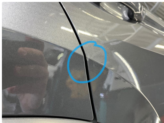
1.1 P bulker