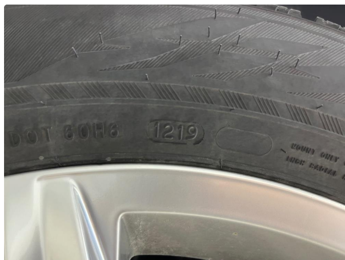
1.2 Dekk fra 2019, godt mønster.