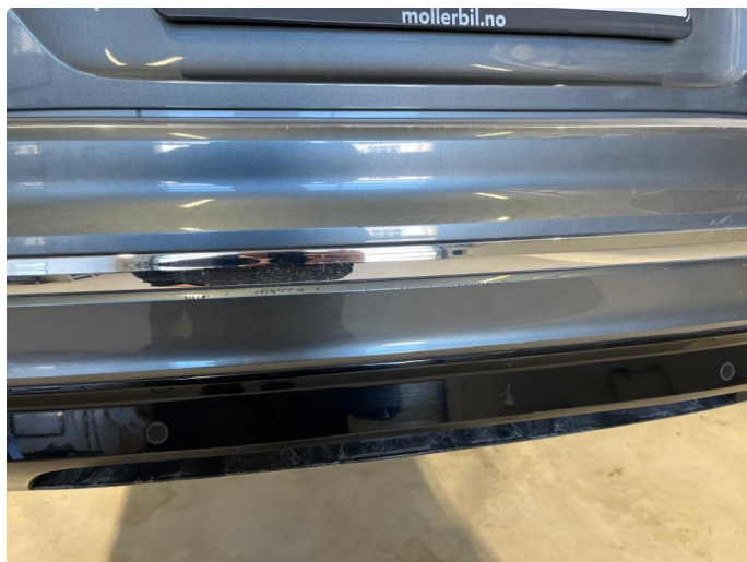
1.3 Skrubbskader underkant