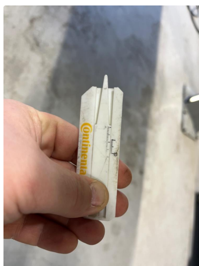
1.2 Dekk fra 2019, godt mønster.