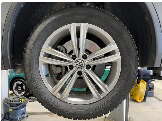
1.2 Dekk fra 2019, godt mønster.