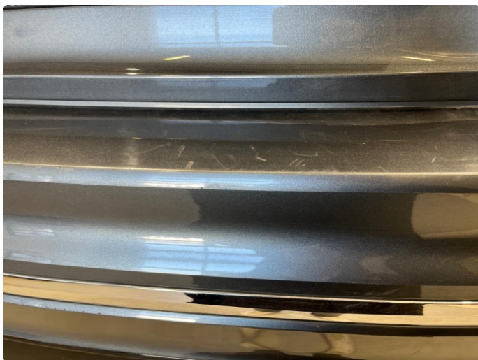
1.3 Skrubbskader underkant