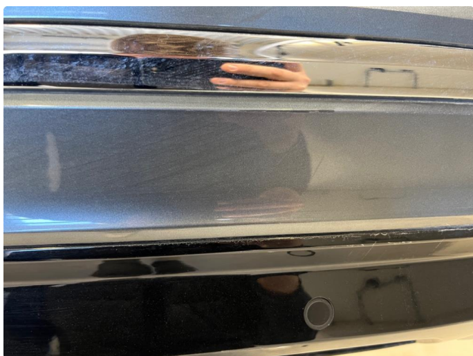
1.3 Skrubbskader underkant