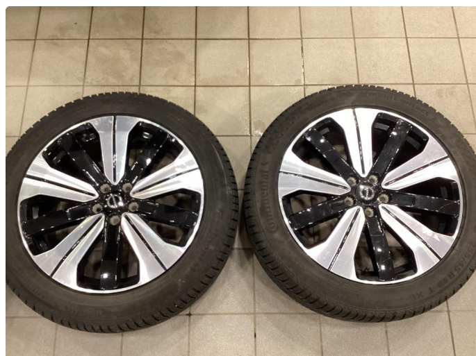
1.2 Info bilder av vinterhjul