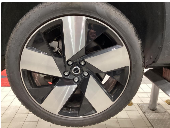
1.3 Info bilder av sommerhjul