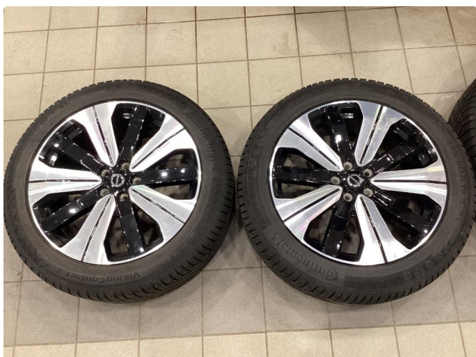
1.2 Info bilder av vinterhjul