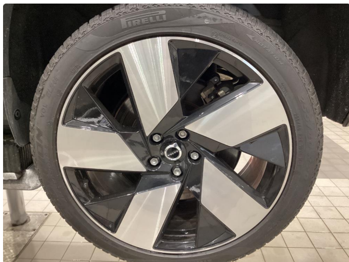
1.3 Info bilder av sommerhjul