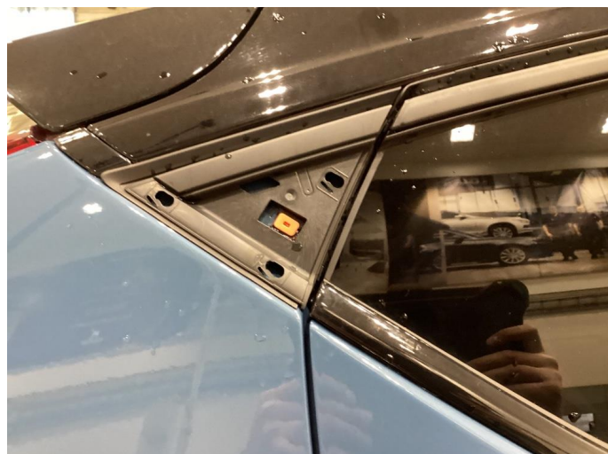
1.1 Løse/skadede lister - Byttet på garanti