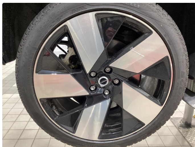
1.3 Info bilder av sommerhjul