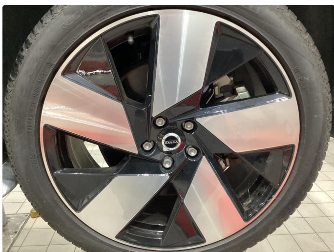
1.3 Info bilder av sommerhjul