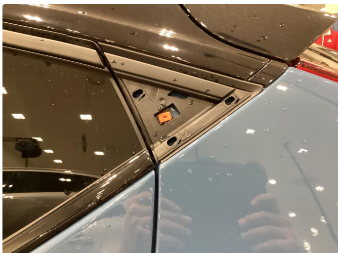
1.1 Løse/skadede lister - Byttet på garanti