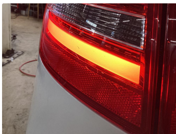
2.1 Sprekker i begge høyre lykter bak + litt venstre ytre bak.