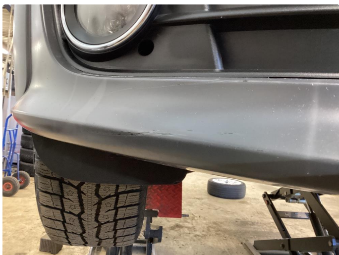
1.2 Ripe å bulk i plast foran å bak.