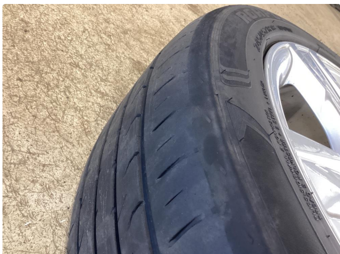
1.1 Ett somerdekk er skjevslitt.