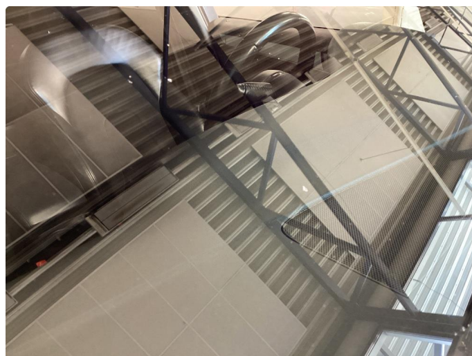
1.3 2 små steinknatt