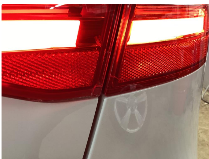
2.1 Sprekker i begge høyre lykter bak + litt venstre ytre bak.