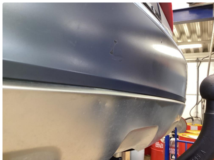
1.2 Ripe å bulk i plast foran å bak.