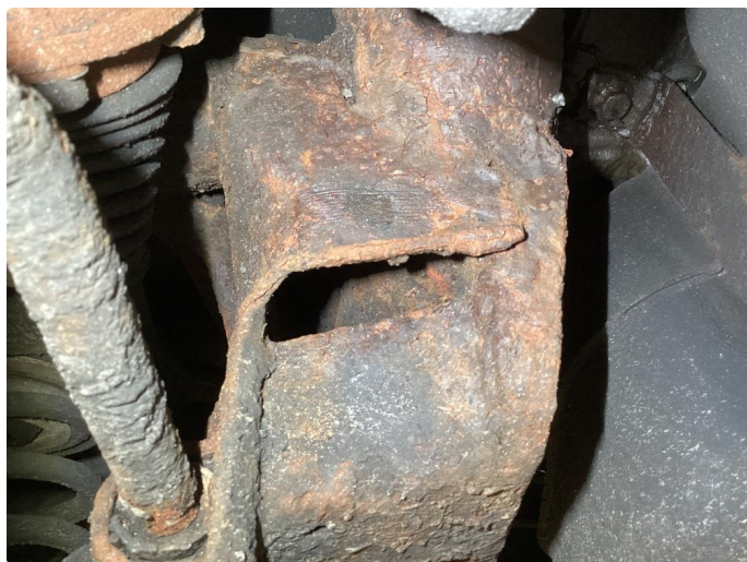
1.5 Generelt mye rust