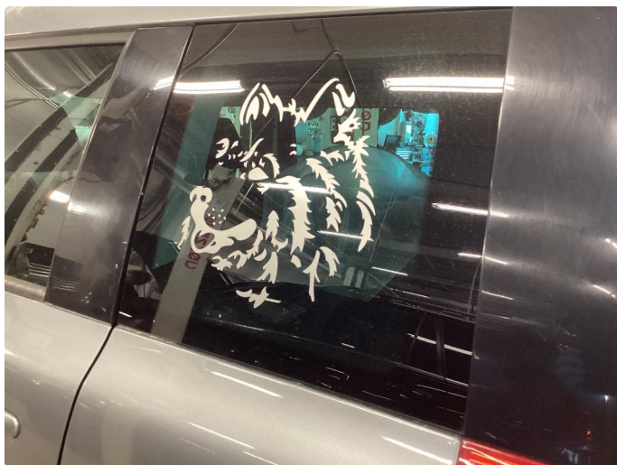
2.1 Fjerne dekor/logo