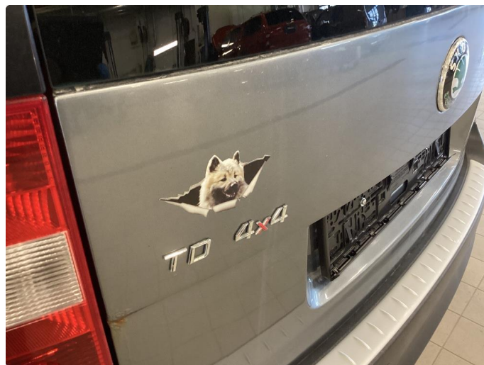
2.1 Fjerne dekor/logo