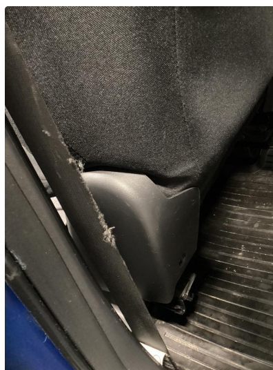
4.1 Skade på belte