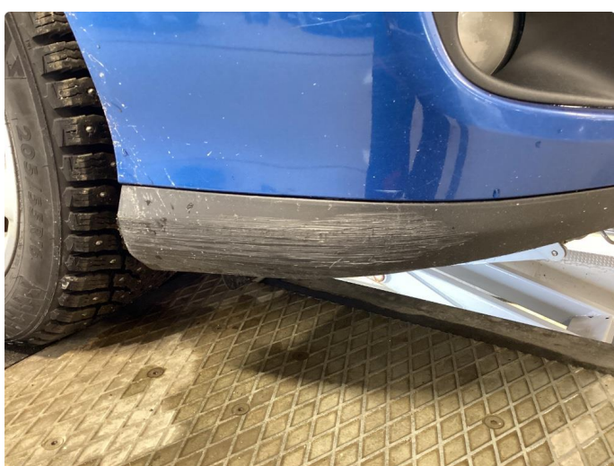
1.5 Skrubbskader underkant