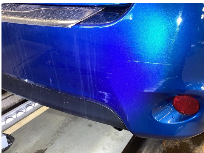
1.4 Bulk med lakkskade