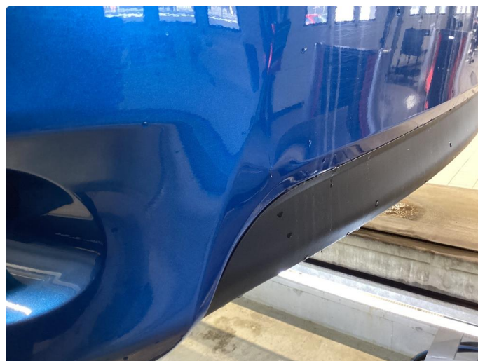
1.4 Bulk med lakkskade