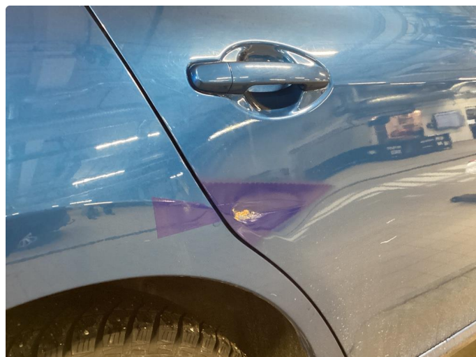
1.3 Bulk med lakkskade