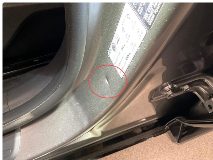
1.2 Bulk(er) med lakkskade