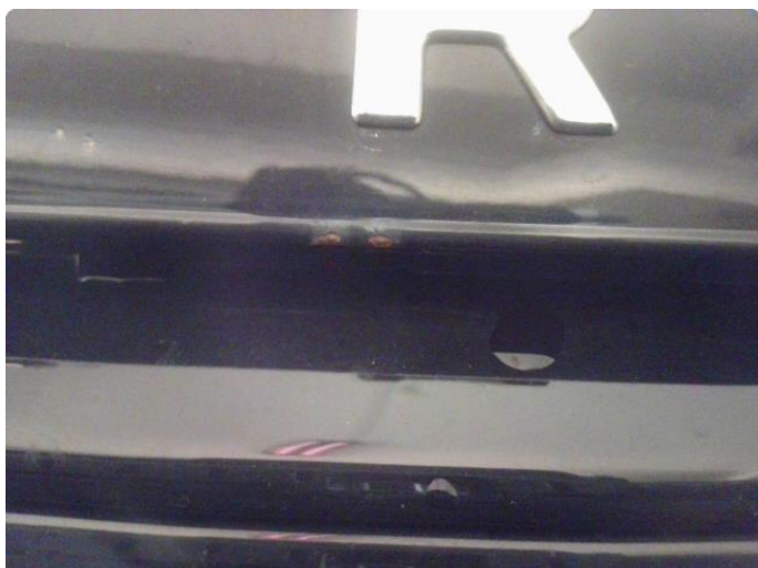
1.2 Noe steinsprut med rust