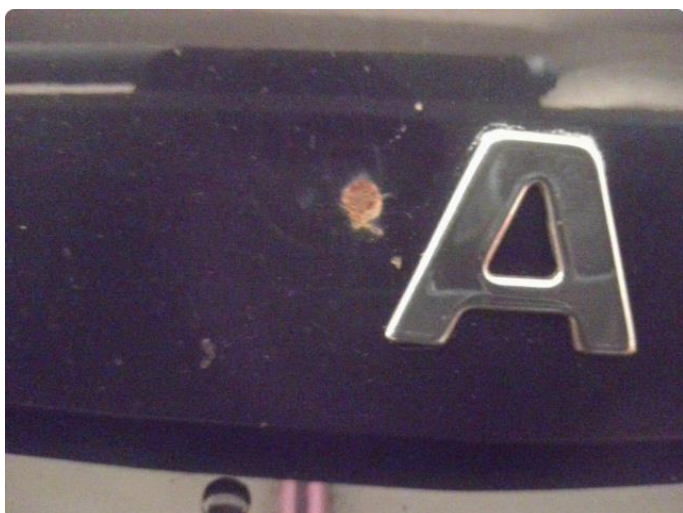
1.2 Noe steinsprut med rust