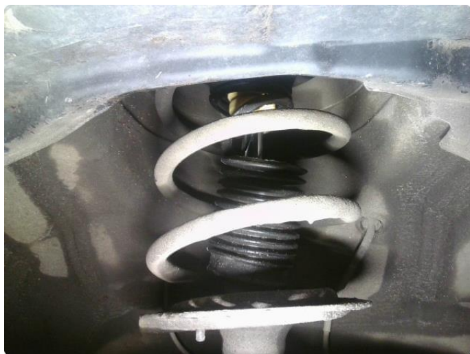
2.1 Støvmansjett defekt