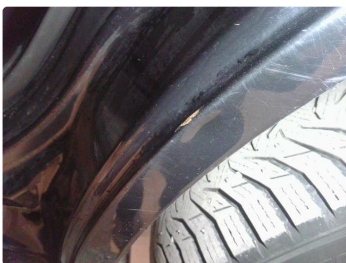
1.4 Bulk(er) med lakkskade