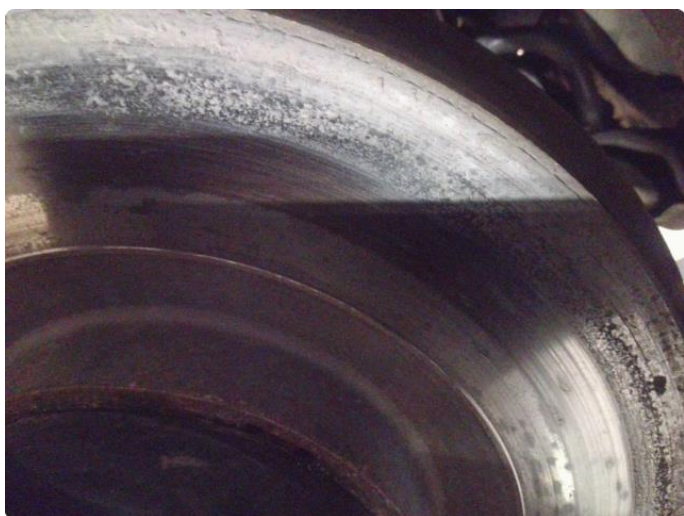
3.2 Slitte/stor slitekant