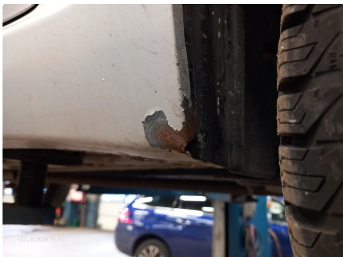
1.1 Lakk flasser