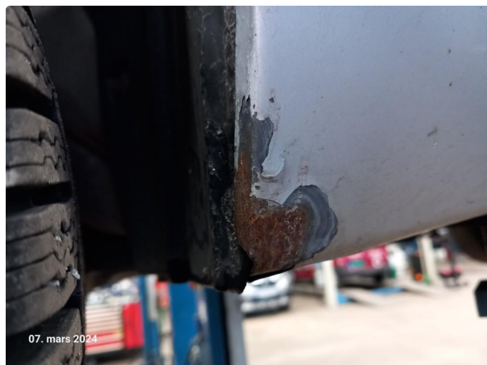
1.1 Lakk flasser