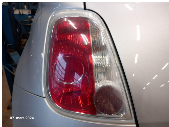
2.2 Noe dugg/fukt