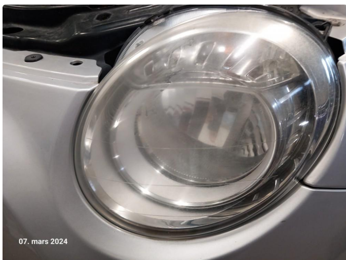
2.1 Matte lykteglass