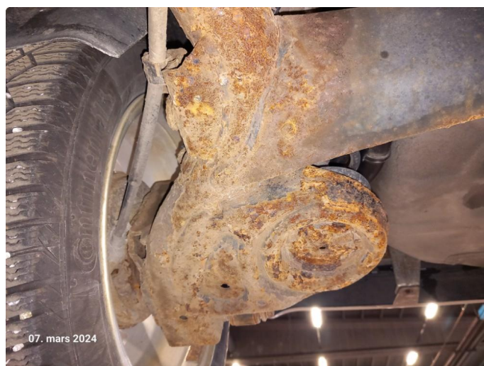
4.1 Overflaterust på bakaksel