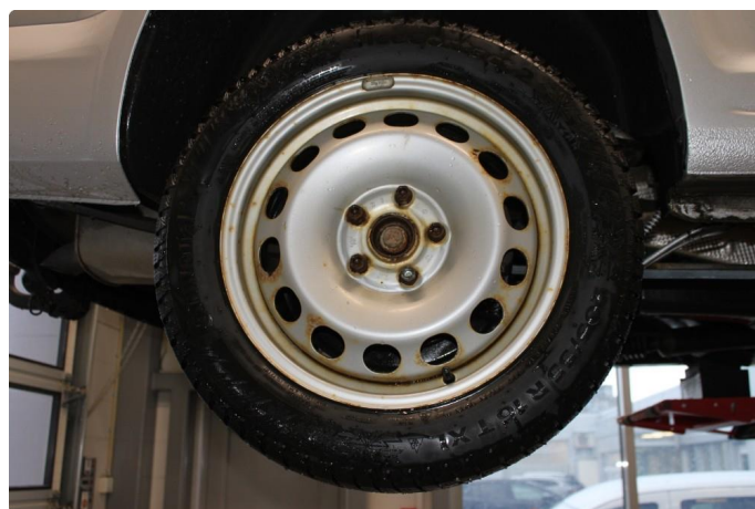
1.3 Mye oksidering på vinterfelgene