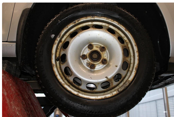
1.3 Mye oksidering på vinterfelgene