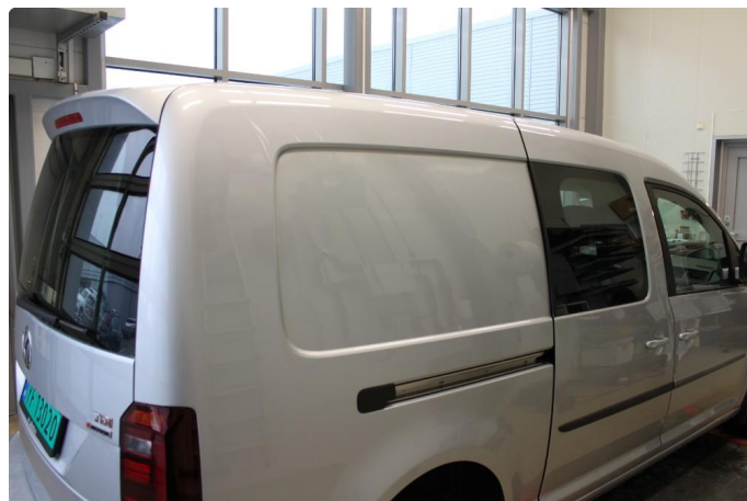
1.1 En del små utoverbulker på alle panel i varerom, ikke uvanlig på denne type bil.