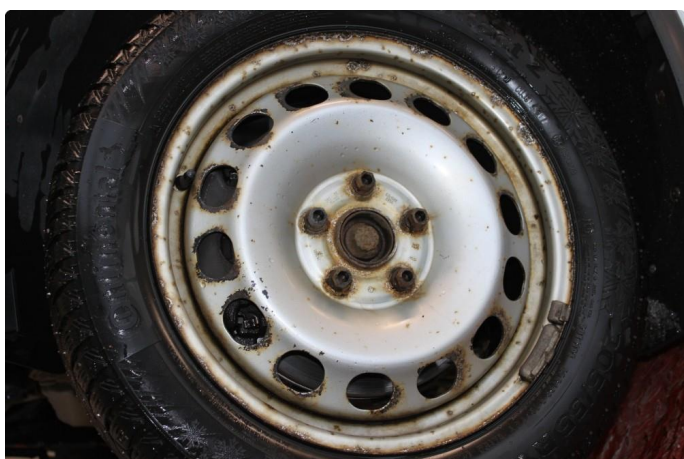
1.3 Mye oksidering på vinterfelgene