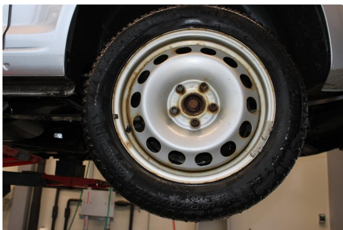
1.3 Mye oksidering på vinterfelgene