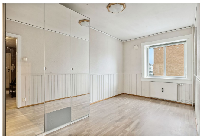
Innbydende soverom med garderobeskap