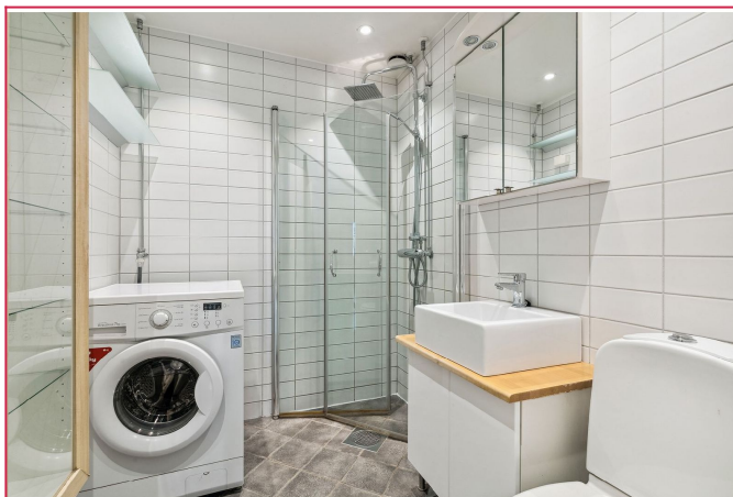
Pent flislagt bad med regnfallsdusj og vaskemaskin