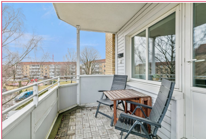
Fra stuen er det tilgang til flott balkong