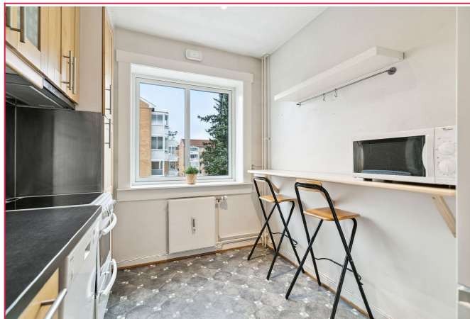
Separat kjøkken med tilhørende hvitevarer og spiseplass