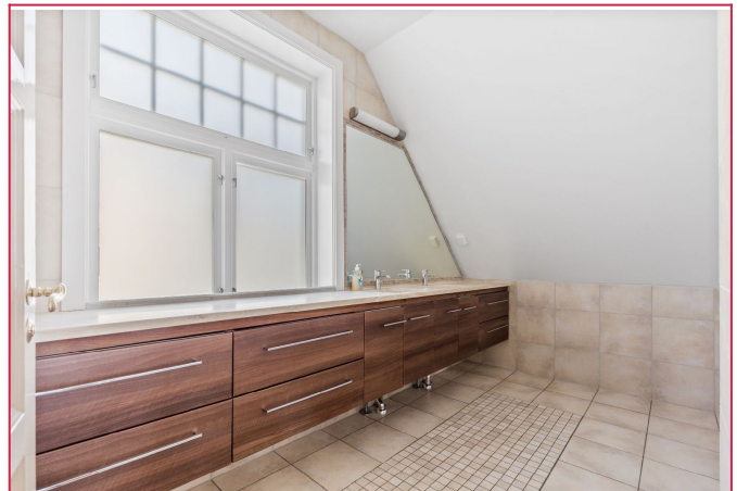
Romslig bad_her ser du bare baderomsinnredningen_det er en avdeling til med boblekar og dusj