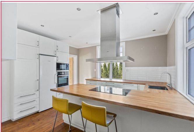
Romslig delikat kjøkken med alle hvitevarer