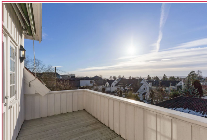
Utsikt ifra balkong i 2. etg.