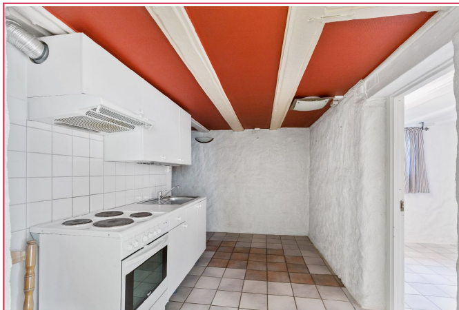
Kjøkken nede i kjeller i forbindelse med praktikant-delen