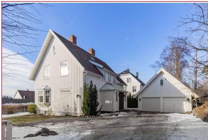
Fasade av ifra innkjørselen