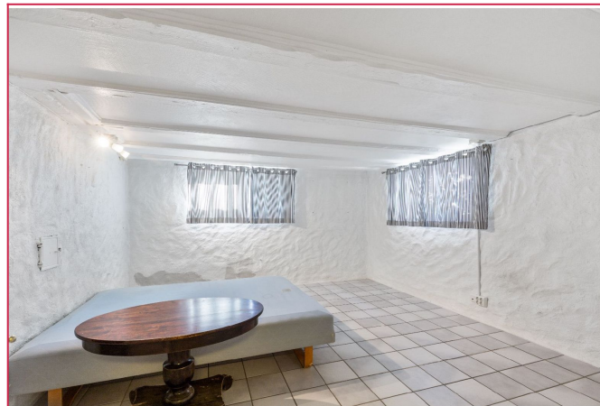
Oppholdsrom / stue nede i kjelleren